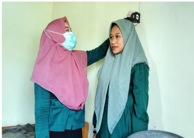
Gambar 2. Pemeriksaan Ibu Hamil ( Antenatal Care ) (Bidan Koordinator Puskesmas Atari Jaya)