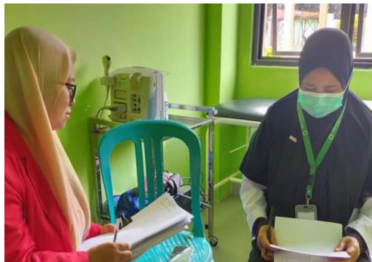
Gambar 10. Wawancara dengan Informan Biasa (Bidan Koordinator Puskesmas Motaha)