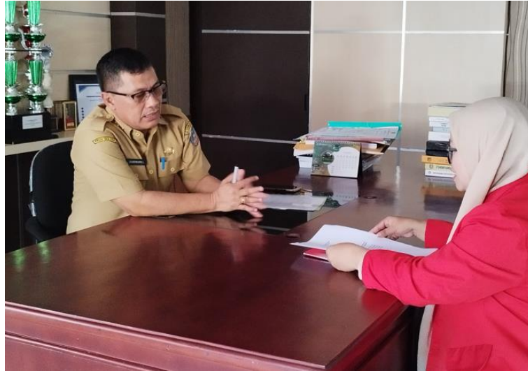
Gambar 13. Wawancara dengan Informan Biasa (Kepala Badan Perencanaan Pembangunan Daerah Kabupaten Konawe Selatan)