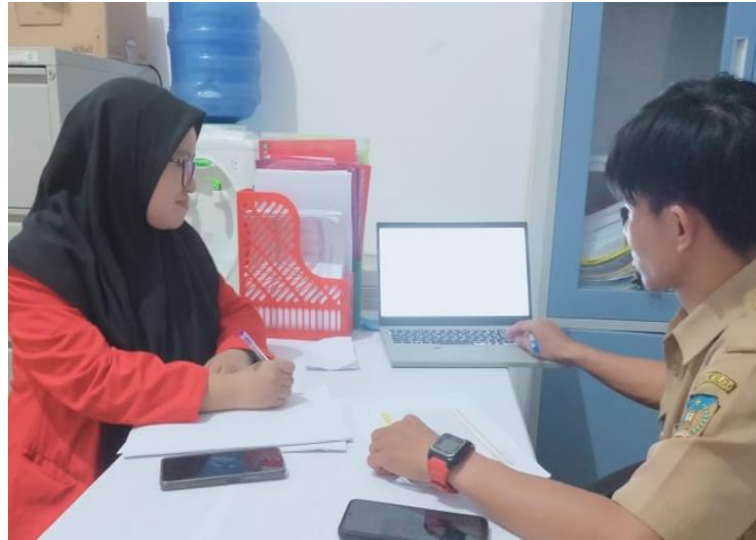
Gambar 3. Wawancara dengan Informan Kunci (Staf Subbagian Penyusunan Program dan Pelaporan Dinas Kesehatan Kab. Konawe Selatan)