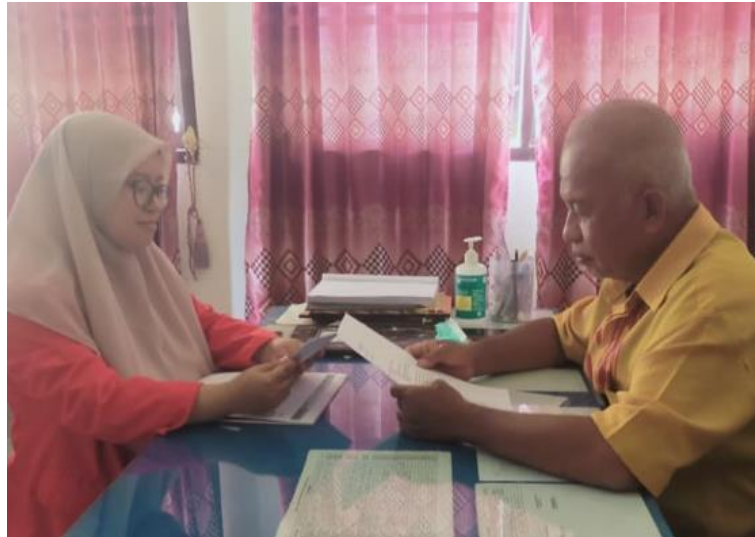
Gambar 5. Wawancara dengan Informan Biasa (Kepala Puskesmas Atari Jaya)