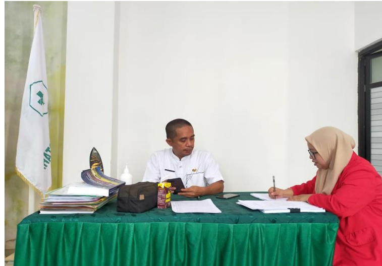
Gambar 9. Wawancara dengan Informan Biasa (Kepala Puskesmas Motaha)