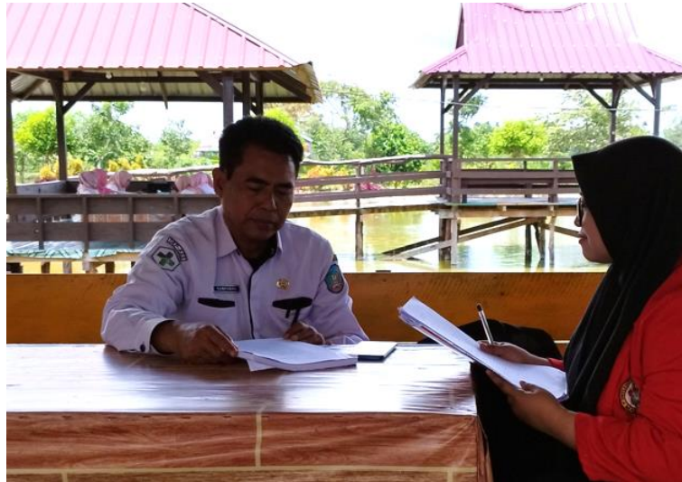
Gambar 11. Wawancara dengan Informan Biasa (Kepala Puskesmas Konda)