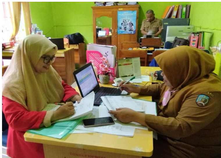
Gambar 2. Wawancara dengan Informan Kunci (Koordinator Program Kesehatan Keluarga Dinas Kesehatan Kab. Konawe Selatan)