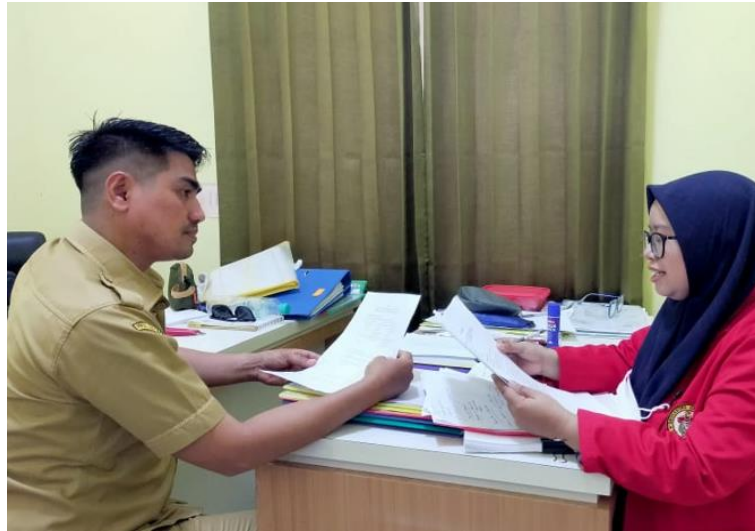
Gambar 7. Wawancara dengan Informan Biasa (Kepala Puskesmas Tinanggea)