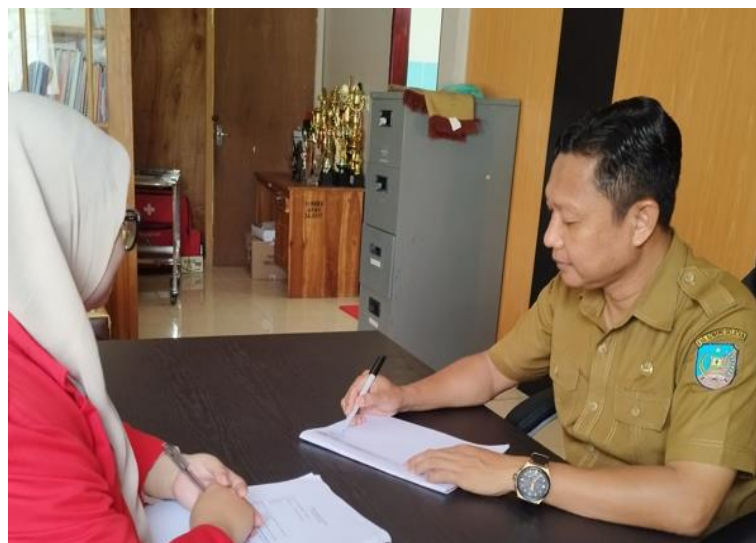
Gambar 4. Wawancara dengan Informan Kunci (Kepala Dinas Kesehatan Kab. Konawe Selatan)