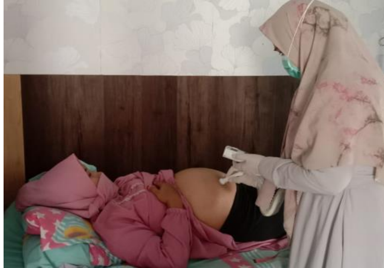
Gambar 1. Pemeriksaan Ibu Hamil ( Antenatal Care ) (Bidan Koordinator Puskesmas Konda)