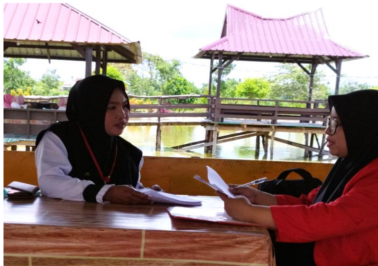
Gambar 12. Wawancara dengan Informan Biasa (Bidan Koordinator Puskesmas Konda)