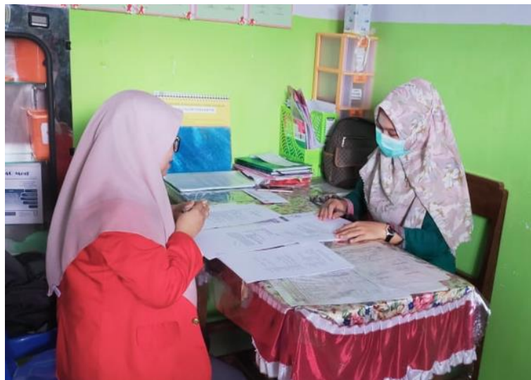
Gambar 6. Wawancara dengan Informan Biasa (Bidan Koordinator Puskesmas Atari Jaya)