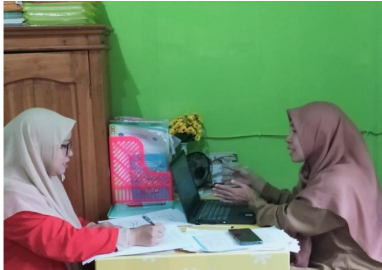
Gambar 1. Wawancara dengan Informan Kunci (Koordinator/Pengelola Program Kesehatan Ibu Dinas Kesehatan Kab. Konawe Selatan)