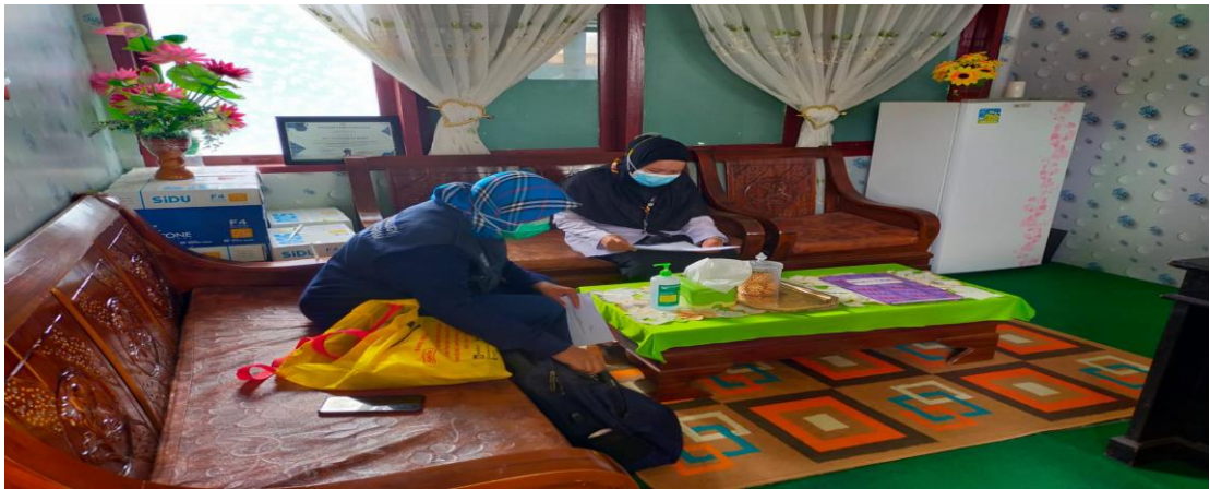
Gambar 2 : Pengelola Surveilans Puskesmas Sewo