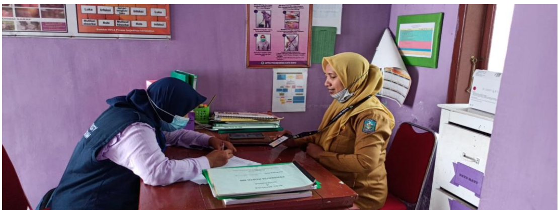
Gambar 3 : Pengelola Surveilans Puskesmas Malaka