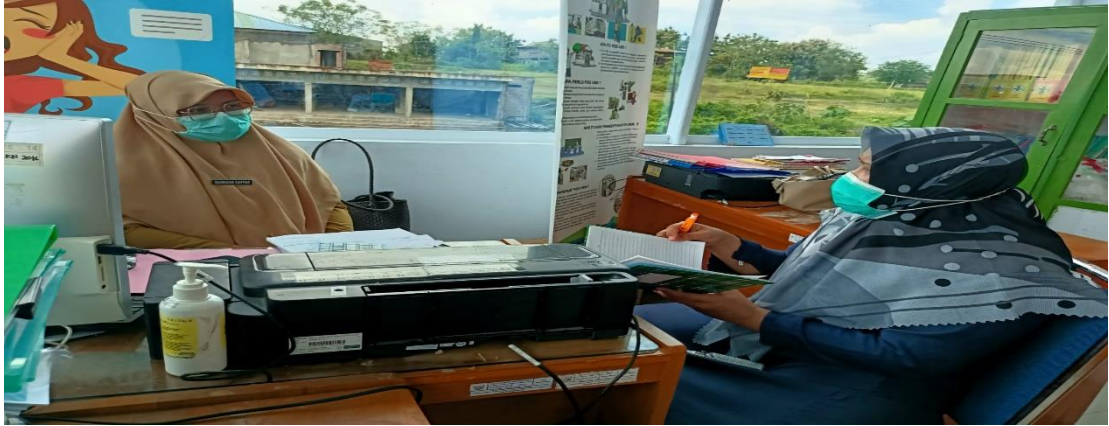
Gambar 1: Pengelola Surveilans Puskesmas Salotungo