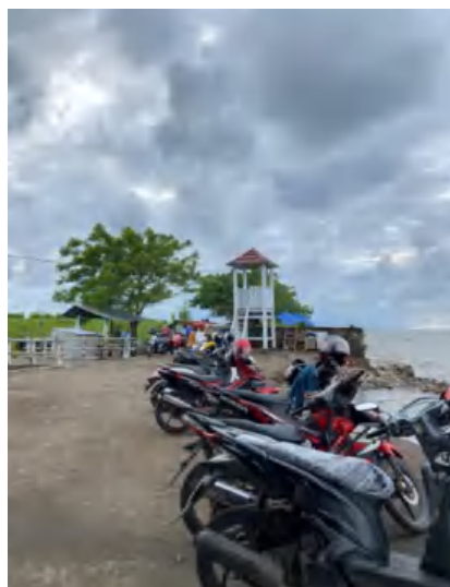
Parkiran pantai Tanjung Layar Putih