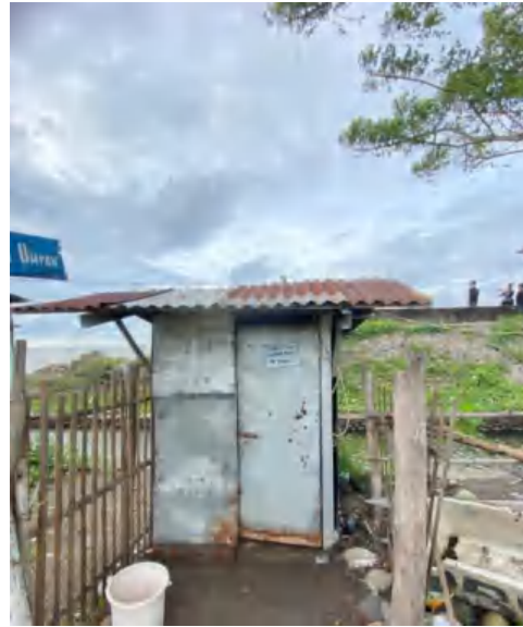
Toilet Umum Pantai Tanjung Layar Putih