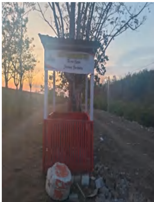
Tempat Pembayaran Karcis Masuk