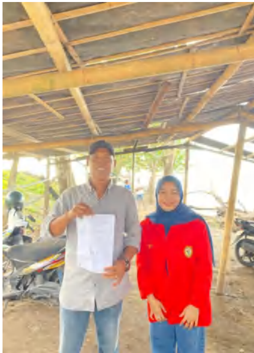
Foto Bersama Pihak Pengelola Pantai Tanjung Layar Putih