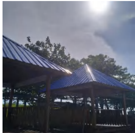
Gazebo Pantai Tanjung Layar Putih