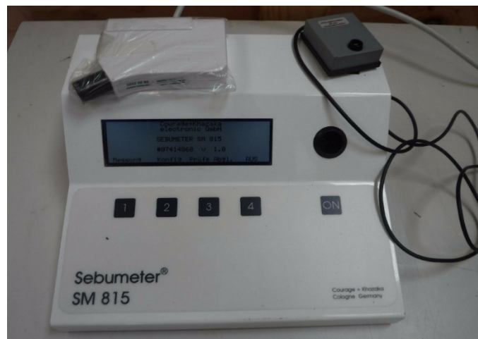
Gambar 1. Sebumeter SM 815® (Courage & Khazaka Electronic Co, Cologne, Germany)

Germany) terdiri dari sebuah kaset yang berisi gulungan plastik film dan kotak kecil dengan fotometer didalamnya. Pada saat film tersebut di aplikasikan ke kulit maka sebum akan di absorpsi selama 30 detik sehingga berubah transparan. Perubahan film menjadi transparan kemudian di ukur oleh fotometer yang terdapat di dalam kotak sebumeter, diukur secara otomatis dan cepat sehingga keluar hasil konsentrasi sebum dalam satuan microgram per sentimeter persegi ( \mu\text{g}/\text{cm}^2 ). Seluruh prosedur ini membutuhkan waktu lebih dari 1 menit. (Pande and Misri, 2005)