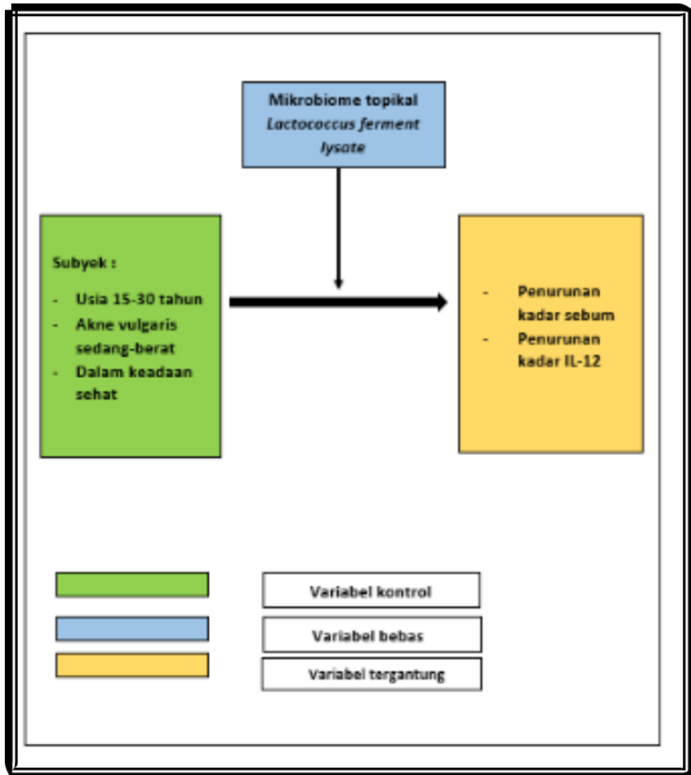
Gambar 3. Kerangka Konsep