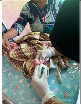
Pemeriksaan kadar hemoglobin (post test)