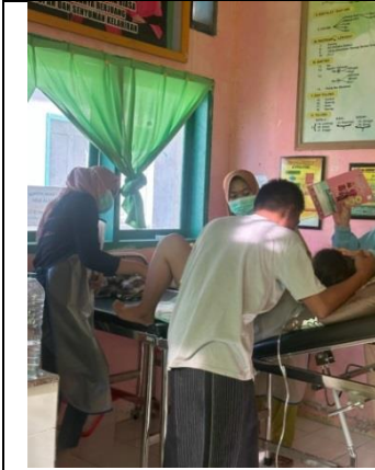
Melakukan penundaan penjepitan tali pusat