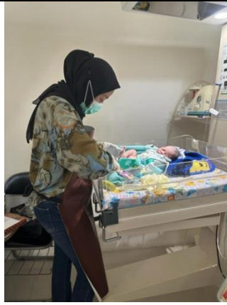
Melakukan pengambilan sampel darah kapiler