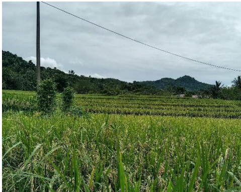
Dokumentasi 3. Lahan pertanian masyarakat Desa Mattirowalie