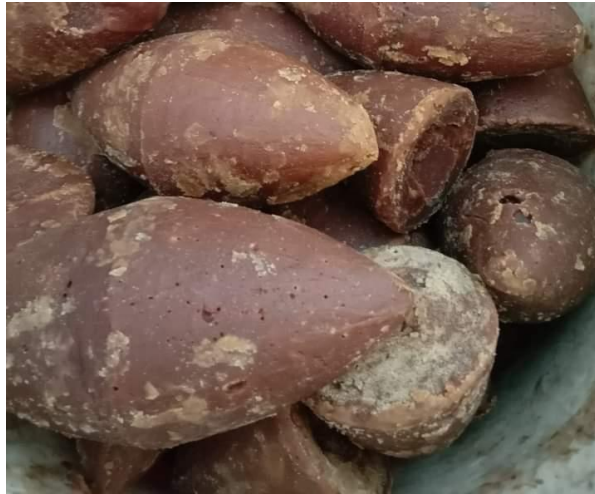
Dokumentasi 6. Gula merah produksi masyarakat