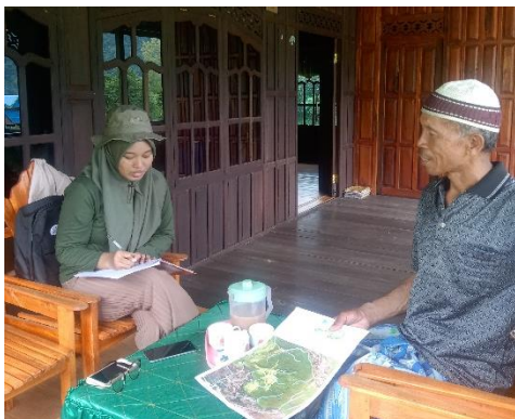
Dokumentasi 5. Wawancara dengan responden