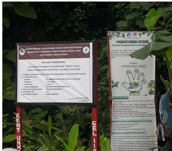
Dokumentasi 8. Areal Hutan Kemasyarakatan Desa Mattirowalie