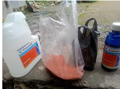
Dokumentasi 2. Pupuk ponska dan racun rumput