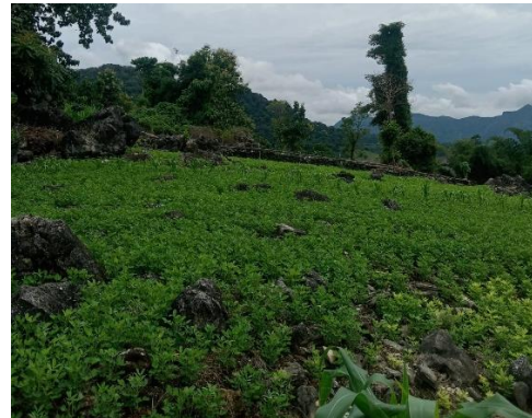
Dokumentasi 4. Lahan perkebunan masyarakat Desa Mattirowalie