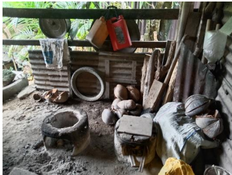
Dokumentasi 1. Dapur produksi aren