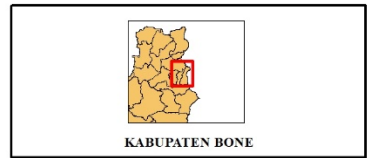
PETA LOKASI PENELITIAN