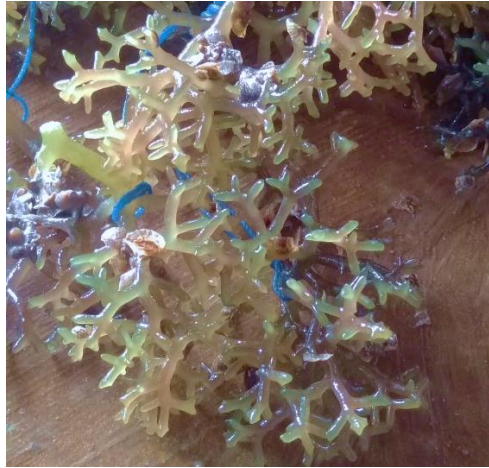
Gambar 1. Kappaphycus alvarezii

Ciri-ciri K. alvarezii adalah thallus dan cabang-cabangnya berbentuk silindris atau pipih, percabangannya tidak teratur dan kasar (sehingga merupakan lingkaran) karena ditumbuhi oleh nodulla atau spine untuk melindungi gametan. Ujungnya runcing atau tumpul berwarna coklat ungu atau hijau kuning. Spina K. alvarezii tidak teratur menutupi thallus dan cabang-cabangnya. Permukaan licin, cartilaginous, warna hijau, hijau kuning, abu-abu atau merah. Penampakan thallus bervariasi dari bentuk sederhana sampai kompleks (Hendrawati, 2016).