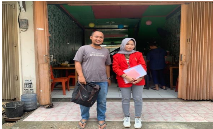
Gambar 3. Wawancara dengan Pemilik UKM Daeng Dagang