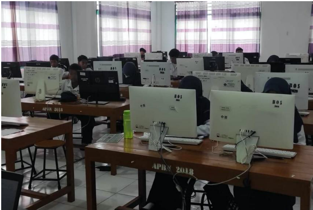
1.5 Lab Komputer SMPN 1 Kendari