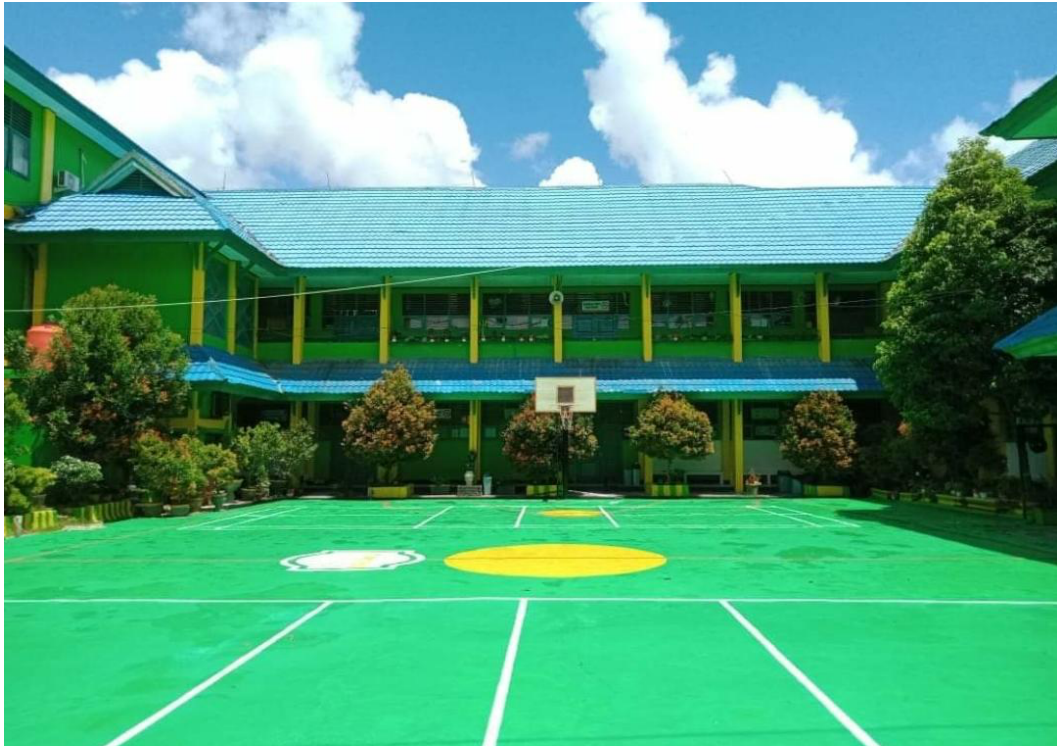
1.3 Lapangan SMPN 1 Kendari