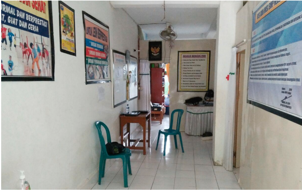
3.1 UKS SMP Negeri 1 Kendari