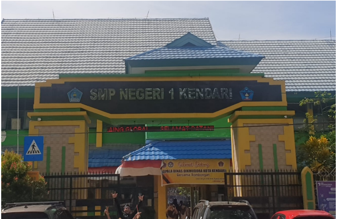
Gambar 1.1 Gerbang SMPN 1 Kendari