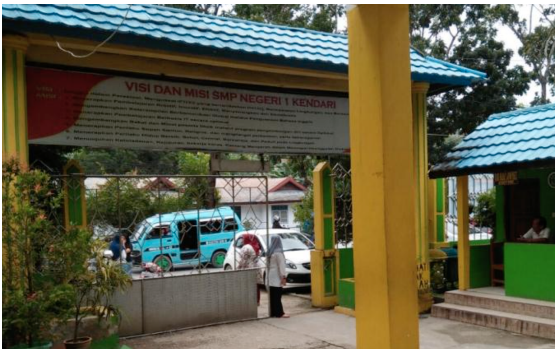
Gambar 1.2 Lingkungan Depan SMPN 1 Kendari