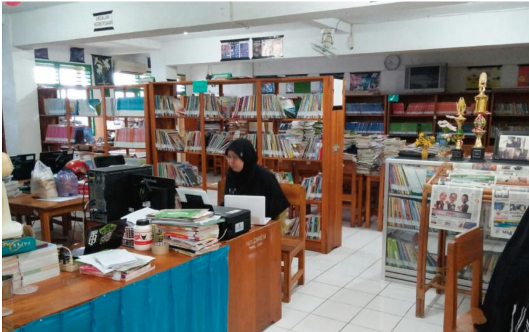
2.2 Ruang Perpustakaan SMPN 1 Kendari