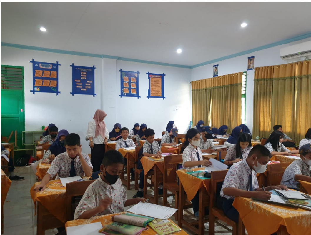
1.4 Ruang belajar SMPN 1 Kendari