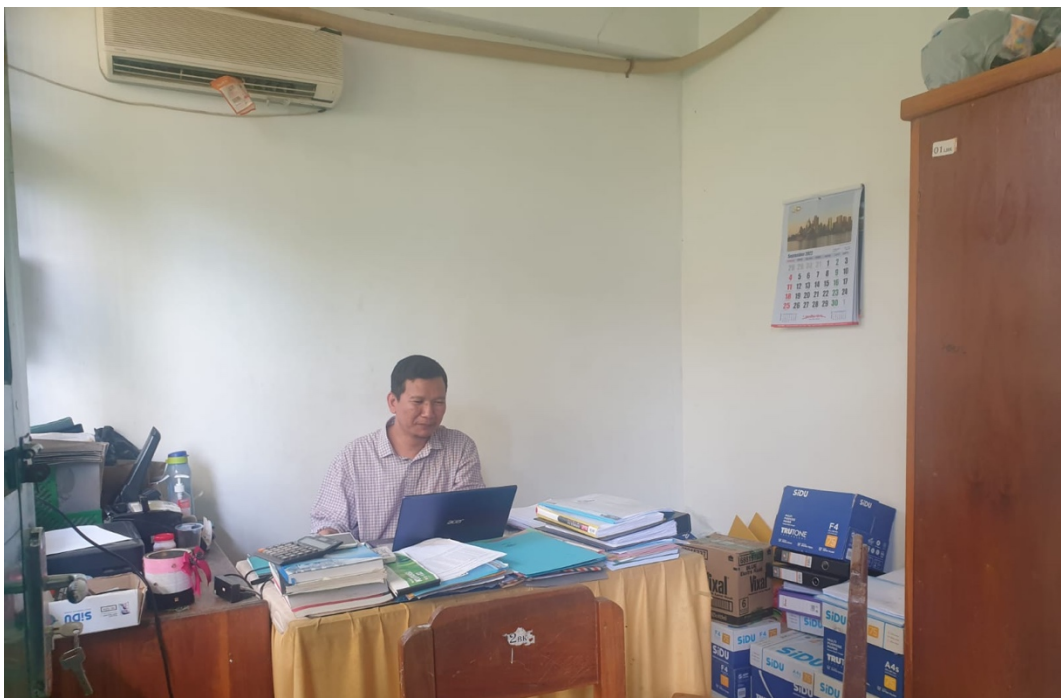
2.1 Ruang Bendahara SMPN 1 Kendari