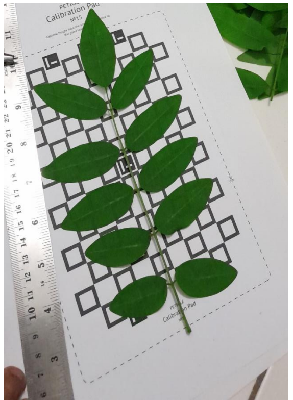
Ket. Persiapan Pengambilan Data Luas Daun Menggunakan Bantuan Kertas Kalibrasi