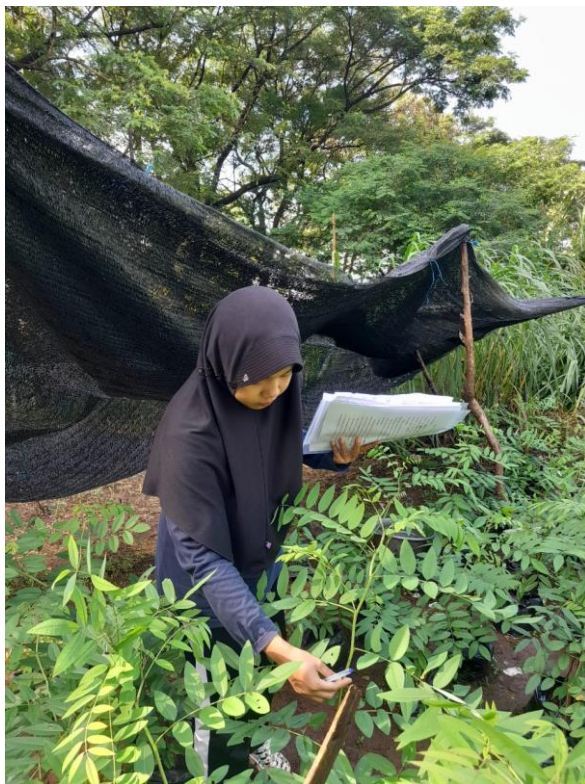
Ket. Pengambilan Data Jumlah Daun