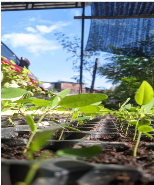
Ket. Pemindahan Bibit Ke Tray