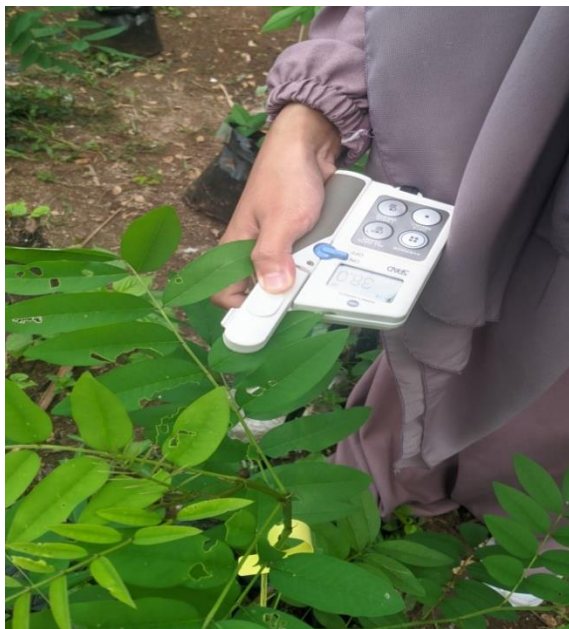
Ket. Nilai Pengambilan Data Jumlah Klorofil Menggunakan Alat Chlorophyll Meter Konica Minolta SPAD-502 Plus