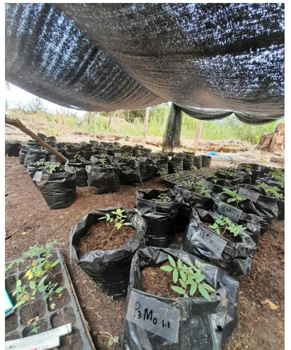
Ket. Pemindahan Ke Polybag