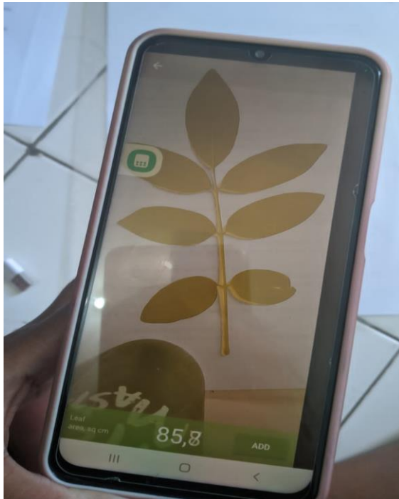
Ket. Pengambilan Data Luas Daun Menggunakan Aplikasi Petiole + Kertas Kalibrasi