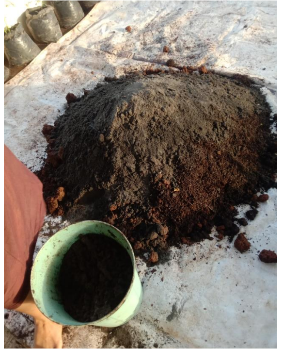
Ket. Pembuatan Media Tanam