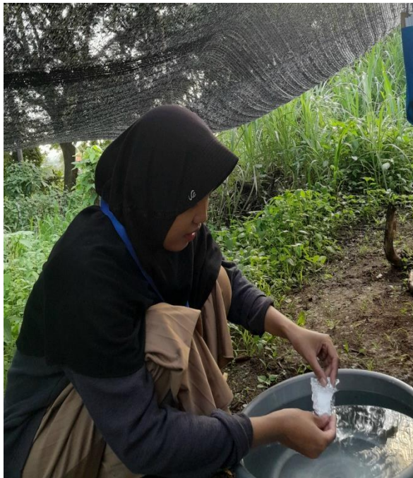
Ket. Pemberian Perlakuan NaCl