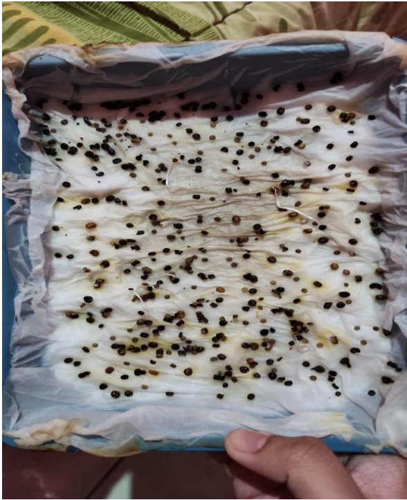
Ket. Penyemaian Benih