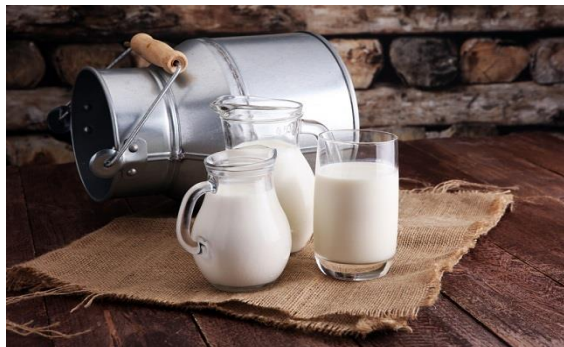
Gambar 1. Susu Sapi (Gustiani, 2009)

tubuh bisa beristirahat dengan baik. Susu mengandung banyak asam amino triptofan yang merupakan salah satu bahan dasar melatonin. Selain itu, susu mempunyai kemampuan mengikat logam-logam yang bertebaran akibat polusi. Susu bermanfaat untuk meminimalisasi dampak keracunan logam berat yang secara tidak sengaja masuk ke dalam tubuh karena lingkungan yang berpolusi (Dwidjoseputro, 2005).