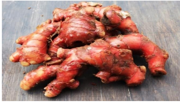
Gambar 4. Jahe Merah (Widiyanti, 2009)

Berdasarkan beberapa penelitian, dalam minyak atsiri jahe merah terdapat unsur-unsur n-nonylaldehyde , d-camphene , cineol , geraniol , dan zingiberene . Bahan-bahan tersebut merupakan sumber bahan baku terpenting dalam industri farmasi atau obat-obatan. Kandungan minyak atsiri dalam jahe merah kering sekitar 1 - 3%. Komponen utama minyak atsiri jahe merah yang menyebabkan bau harum adalah zingiberen dan zingiberol. Oleoresin jahe merah banyak mengandung komponen-komponen pemberi rasa pedas yaitu gingerol sebagai komponen utama serta shagaol dan zingeron dalam jumlah sedikit. Kandungan oleoresin jahe merah berkisar antara 0,4 - 3,1 persen (Herlina dkk., 2004).