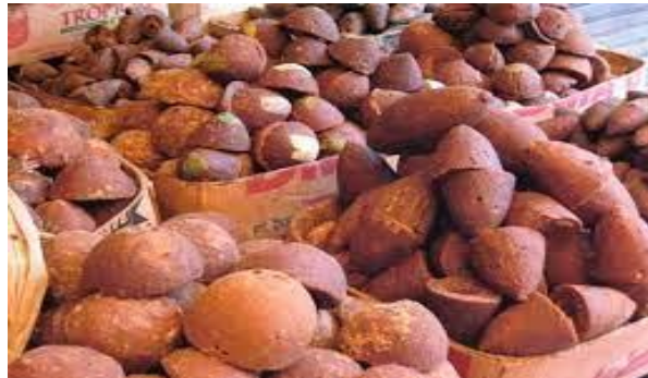
Gambar 3. Gula Aren (Pontoh, 2012)

diantara kristal atau butiran gula sehingga kekerasan gula akan berkurang (Santoso 1993).