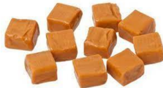
Gambar 2. Permen Karamel (Winarno, 1999)

atau kembang gula. Tiap jenis produksi susu yang beragam memberikan perbedaan selama pengolahan karamel dan masing-masing memberikan tekstur karamel yang berbeda (Alikonis. 1979). Permen susu merupakan produk olahan susu dan gula yang memerlukan suhu tinggi untuk mencapai proses karamelisasi (Nisa et al. , 2015).