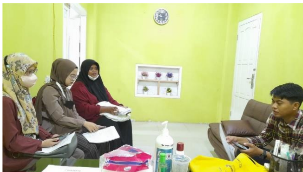
Gambar 2. Observasi data awal di RSUD Labuang Baji Makassar