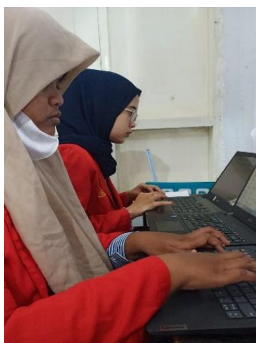
Gambar 4. Pengolahan data di kantor rekam medik RSUD Labuang Baji Makassar