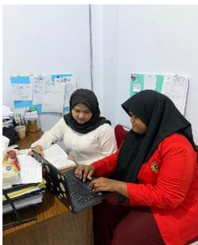
Gambar 3. Pengambilan data di kantor rekam medik RSUD Labuang Baji Makassar