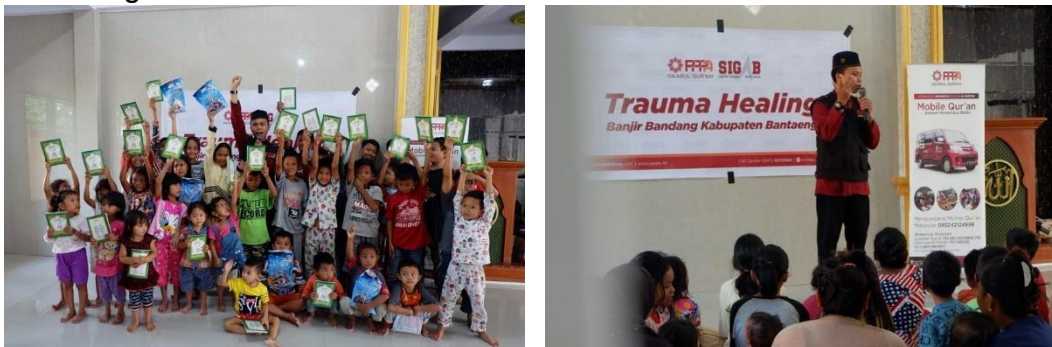
Gambar 6.1 Dokumentasi Trauma Healing korban bencana banjir di Bantaeng