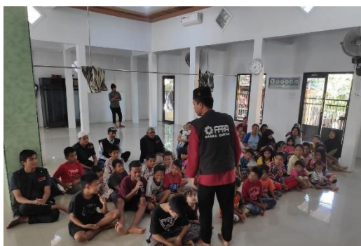
Gambar 6.2. Dokumentasi Kajian Islam Bulanan (KIBI)