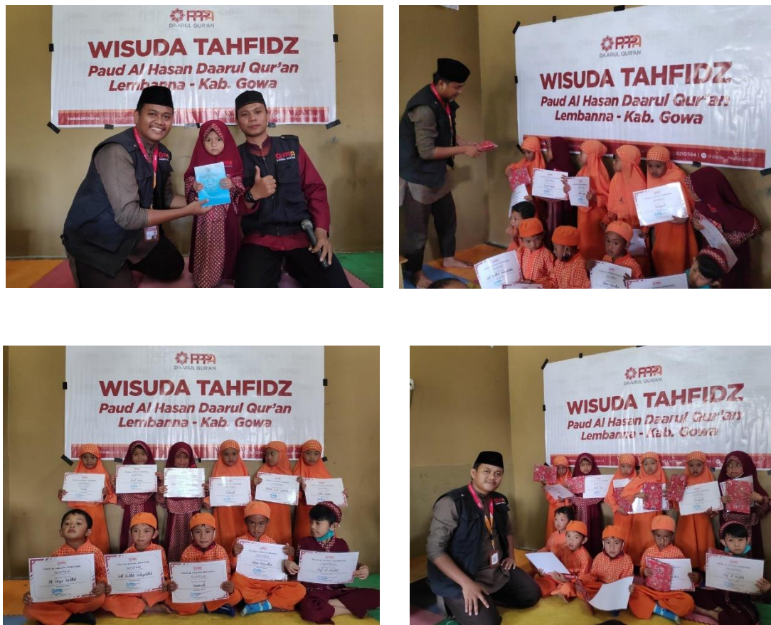
Gambar 6.4. Dokumentasi bantuan dari komunitas