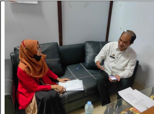
Wawancara dengan Informan dari Badan Kesatuan Bangsa dan Politik