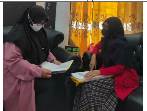
Wawancara dengan Informan dari Reporter Kabar Makassar