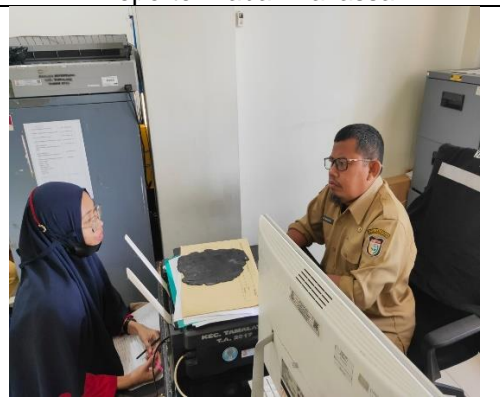
Wawancara dengan Informan dari pihak Kecamatan Tamalate