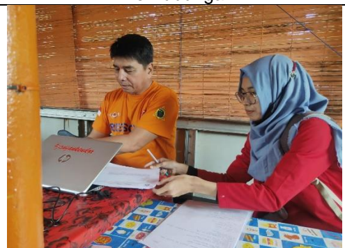
Wawancara dengan Informan dari BPBD