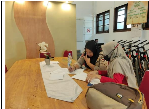
Wawancara dengan Informan dari Satpol PP