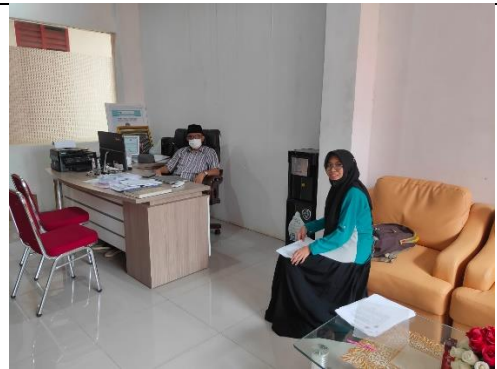
Wawancara dengan Informan Tim Ahli Satgas Covid-19