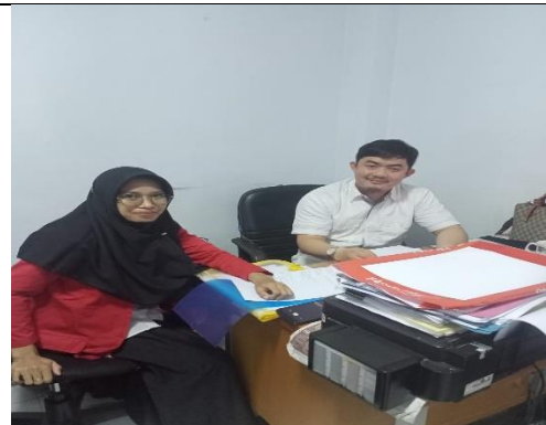
Wawancara dengan informan dari Dinas Perhubungan