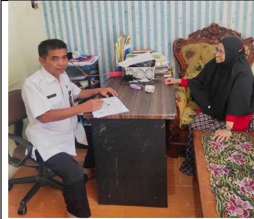
Wawancara dengan Informan warga Kelurahan Maccini Sombala