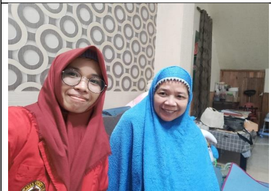
Wawancara dengan Informan warga Kelurahan Kassi-Kassi