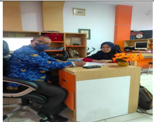
Wawancara dengan Informan dari pihak Kecamatan Rappocini