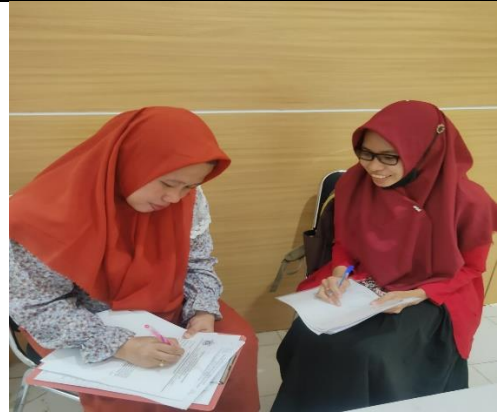
Wawancara dengan Informan dari pihak Kecamatan Manggala