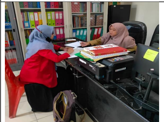
Wawancara dengan Informan dari pihak Kecamatan Panakukang