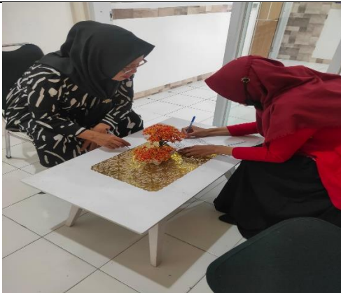
Wawancara dengan Informan warga Kelurahan Borong