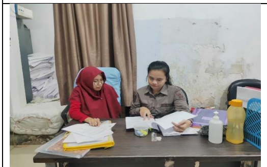
Wawancara dengan Informan dari Dinas Sosial