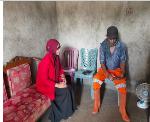
Wawancara dengan Informan warga Kelurahan Bulurokeng