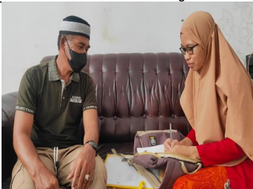
Wawancara dengan Informan warga Kelurahan Paropo