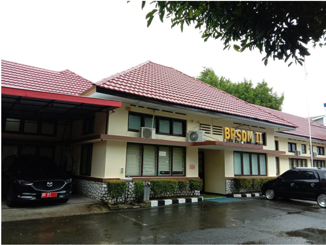
Gedung BPSDM II Provinsi Sulawesi Selatan