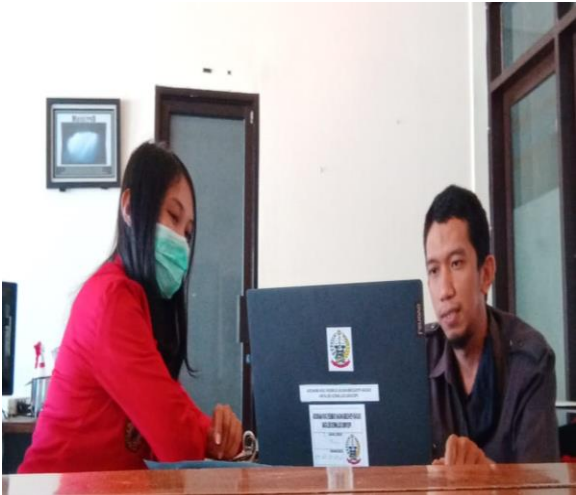
Bersama Staf Bidang Pengembangan