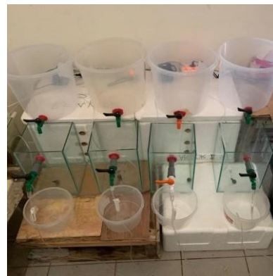
Perakitan reaktor pengolahan