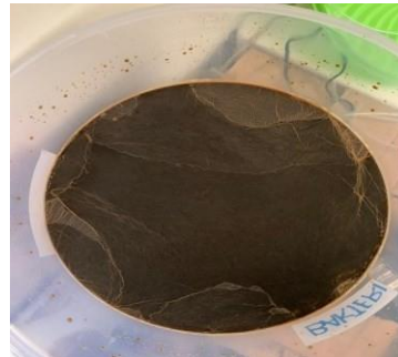
Proses seeding dan aklimatisasi em4