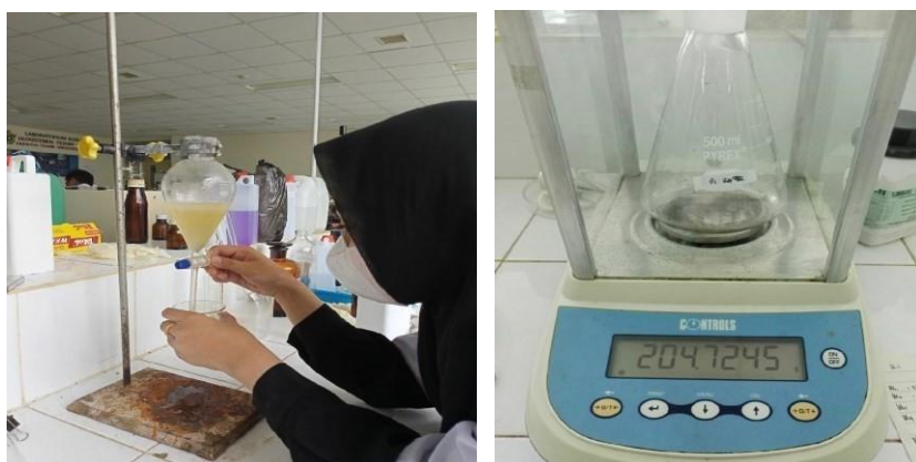
Pengujian Minyak dan Lemak