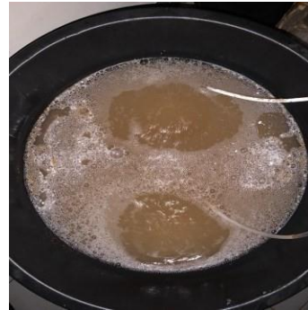
Proses seeding dan aklimatisasi inola 121