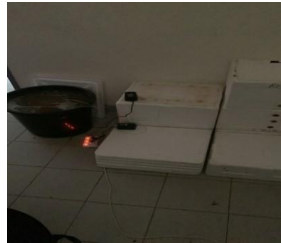
Persiapan alat dan Bahan