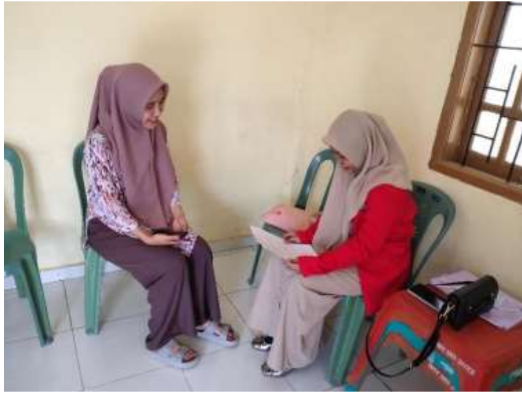
Perizinan penelitian dengan Sekretaris Desa Arasoe