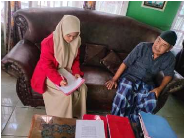
Wawancara dengan Ketua KTH Ujung