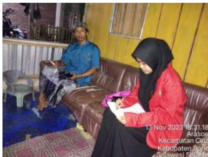
Wawancara dengan Anggota KTH Ujung