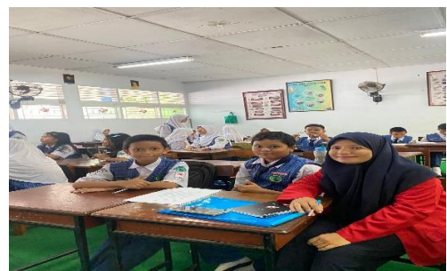
Wawancara Kepada Orang Tua Siswa