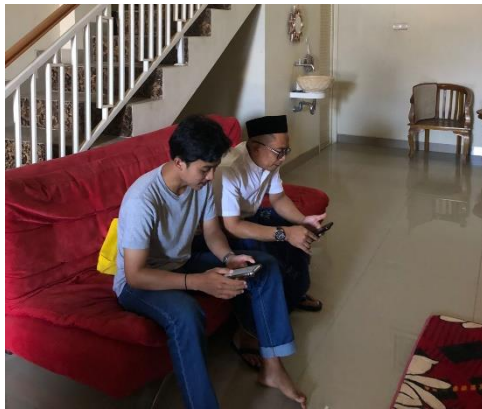
Ket: Wawancara Dengan Informan.