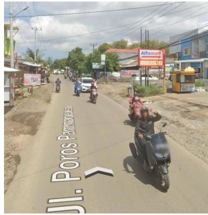
Koordinat: (-5.1489436, 119.5287669)