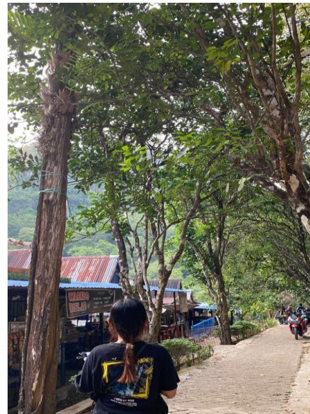
Kegiatan Observasi Lapangan