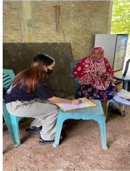
Kegiatan Wawancara Bersama Masyarakat