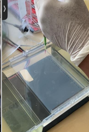
Sampel yang sudah di running dilanjutkan tahap elektroforesis