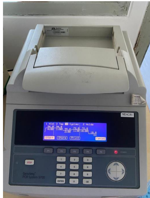
Sampel siap di Running PCR