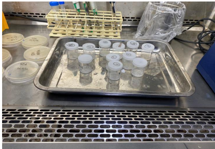
Sampel siap dilakukan kultur dan dilakukan ekstraksi