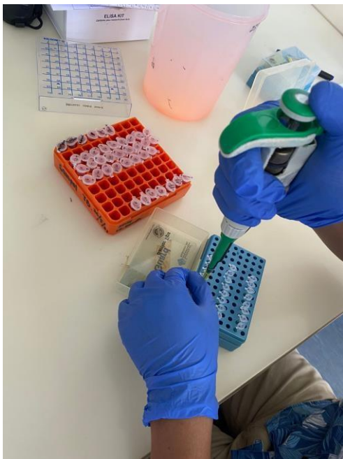
Proses Mix Sampel untuk dilakukan RunningPCR