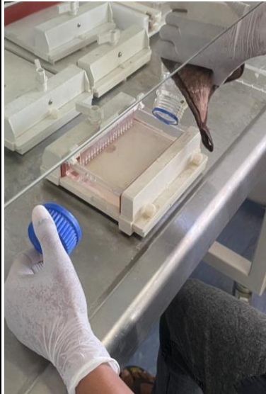
Proses pembuatan Gel Agarose