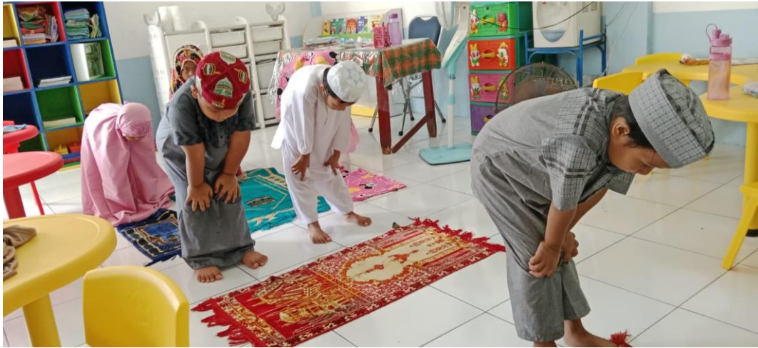
Foto murid kelas I B sedang melakukan sholat dhuha bersama