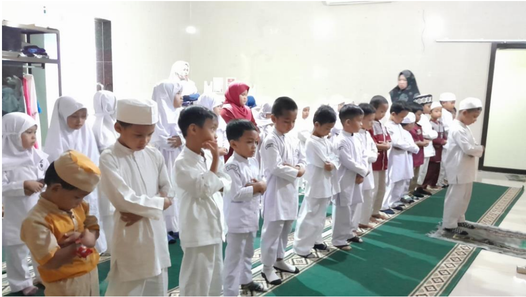
Foto murid kelas II B dan III B sedang melakukan sholat dhuha bersama