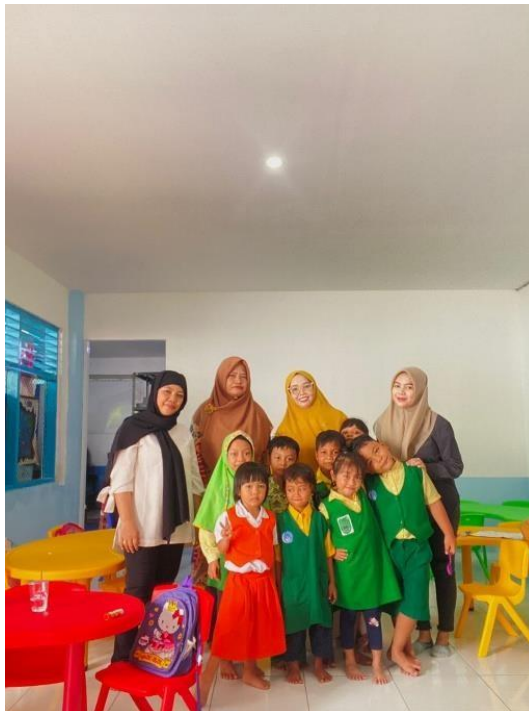
Foto Bersama Guru dan TK Aba Ranting 9 Maccini