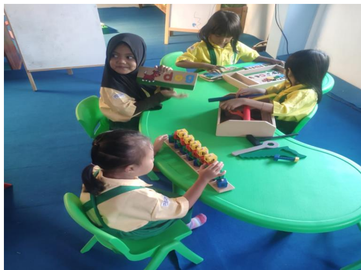
Foto murid kelas II B sedang belajar sambil bermain