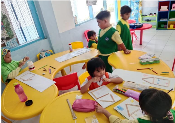
Foto murid kelas I B sedang belajar sambil bermain