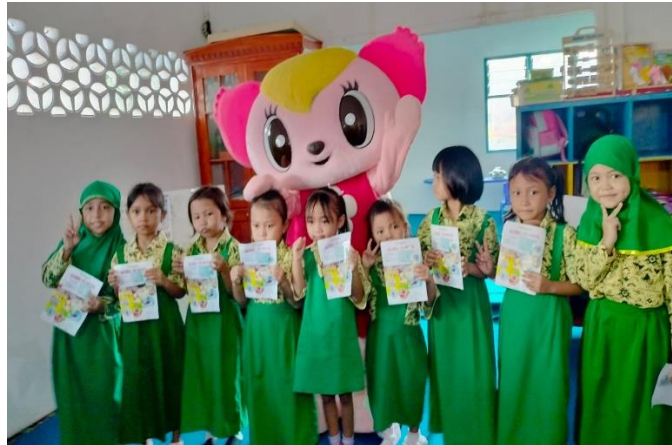
Foto murid kelas III B sedang belajar sambil bermain