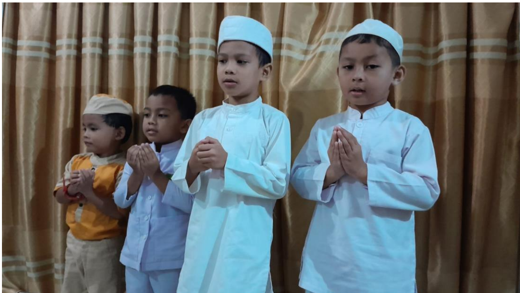
Foto murid kelas II B dan III B sedang melakukan hafalan surah-surah pendek