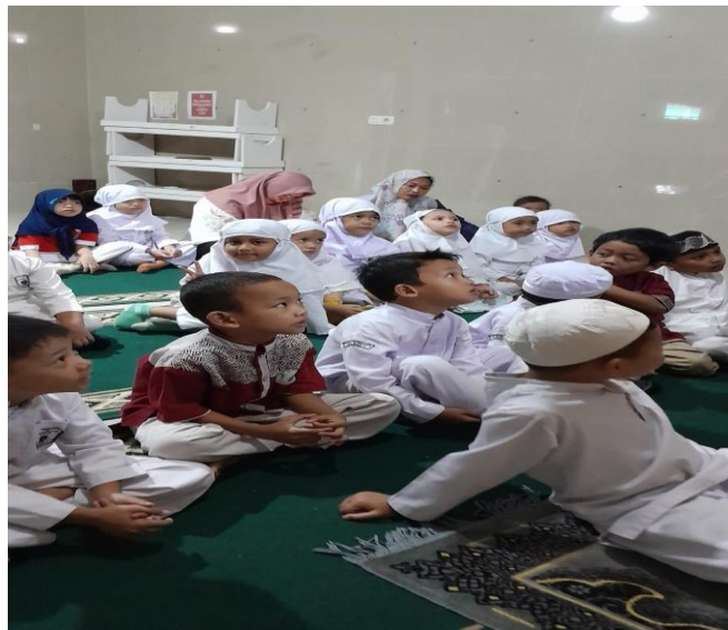
Foto murid kelas I B, II B dan III B sedang melakukan hafalan surah-surah