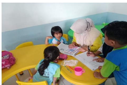
Foto murid kelas I B sedang belajar membaca huruf hijaiyah