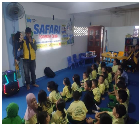
Foto murid kelas II B dan IIIB sedang mendengarkan dongeng