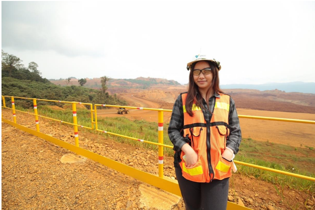
Dokumentasi pribadi di PT. Vale Indonesia TBK, Main Office Plant Site , Sorowako