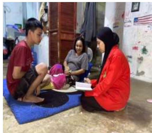
Wawancara pada tanggal 20 Januari 2024 dengan beberapa orang tua peserta didik SMA Negeri 15 Makassar