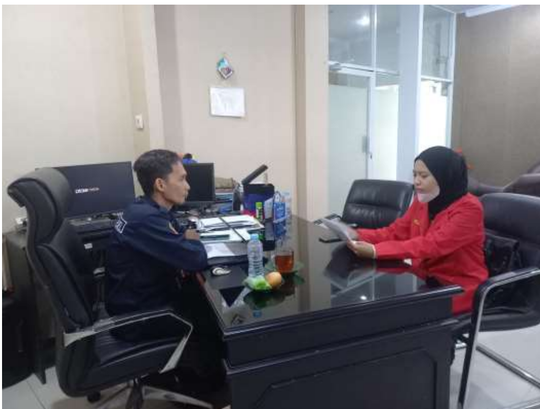
Wawancara pada tanggal 18 Januari 2024 dengan Kepala UPT Pelayanan Teknologi Informasi dan Komunikasi Pendidikan Dinas Pendidikan Provinsi Sulawesi Selatan