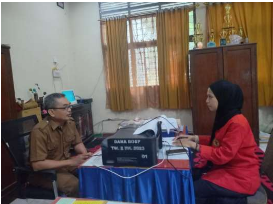
Wawancara pada tanggal 15 Januari 2024 dengan Wakasek Bidang Hubungan Masyarakat (Hubmas) dan Publikasi SMA Negeri 15 Makassar