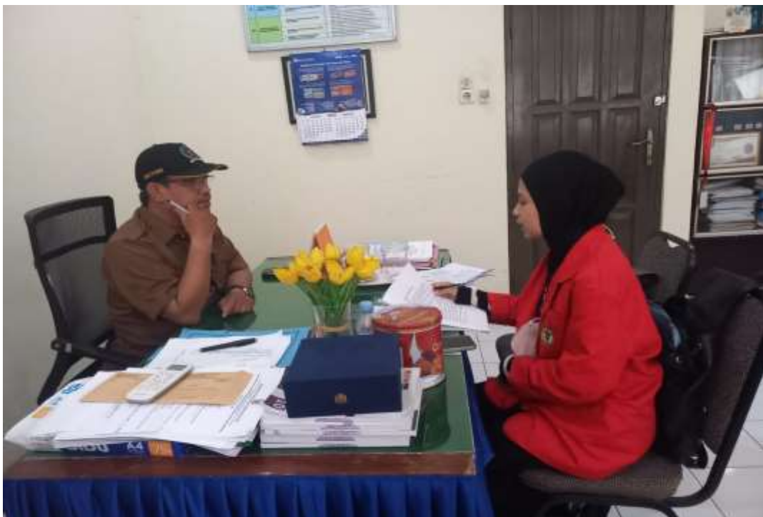
Wawancara pada tanggal 16 Januari 2024 dengan Kepala Sekolah SMA Negeri 15 Makassar