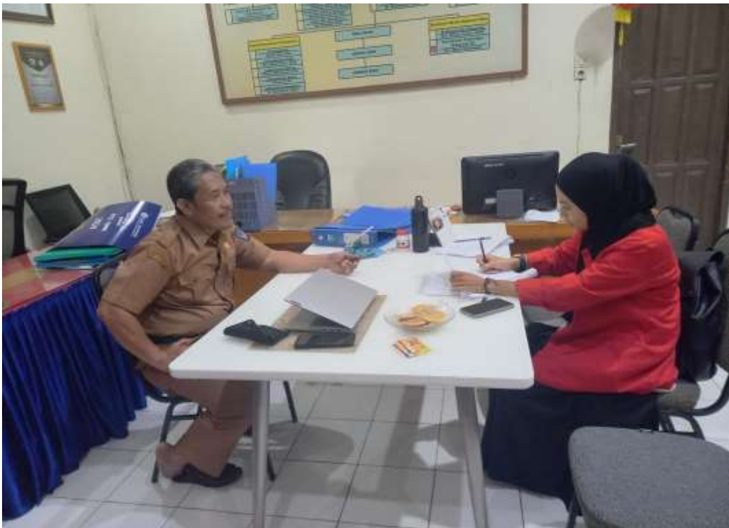
Wawancara pada tanggal 15 Januari 2024 dengan Wakasek Bidang Kesiswaan sekaligus Ketua Panitia PPDB online SMA Negeri 15 Makassar