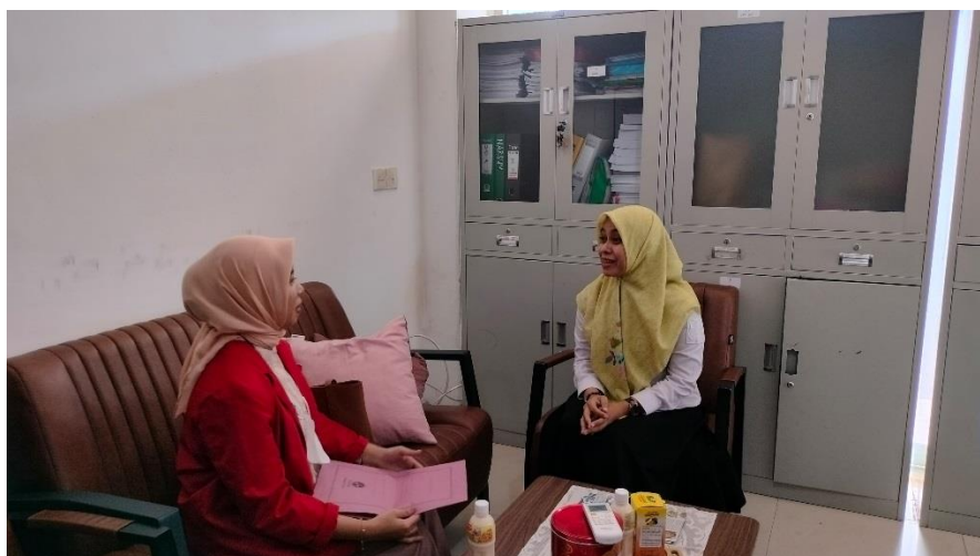
Wawancara bersama Kepala Bidang UKM DISKOPUKM Makassar yang diwakili oleh staf bidang UKM DISKOPUKM Makassar (Kantor Dinas Koperasi dan UKM Kota Makassar, 21 Februari 2024, pukul 15.06 WITA)