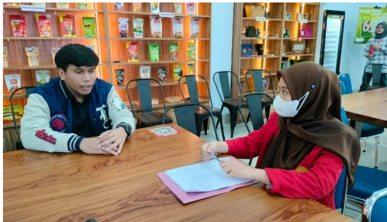
wawancara bersama Manager Inkubator UMKM Makassar (Kantor Inkubator UMKM Kota Makassar, 29 Februari 2024, pukul 14.34 WITA)