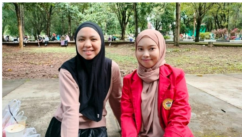
Wawancara bersama konsumen (Carr Free Day Unhas Makassar, 18 Februari 2024, pukul 09.13 WITA)