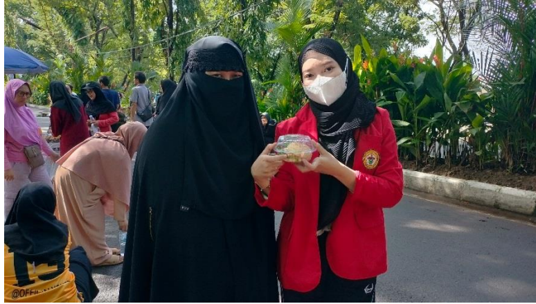
Wawancara bersama pelaku UMKM yang tidak mengikuti program UMKM Makassar (Carr Free Day Unhas Makassar, 11 Februari 2024, pukul 08.50 WITA)