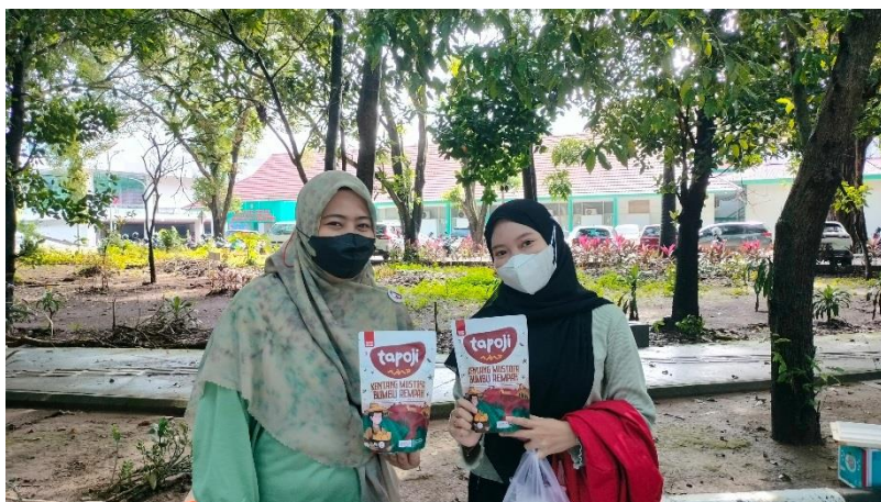
Wawancara bersama pelaku UMKM sekaligus peserta Inkubator UMKM Makassar (Carr Free Day Unhas Makassar, 04 Februari 2024, pukul 09.45) WITA