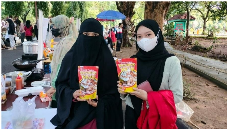
Wawancara bersama pelaku UMKM sekaligus peserta Inkubator UMKM Makassar (Carr Free Day Unhas Makassar, 04 Februari 2024, pukul 09.09 WITA)