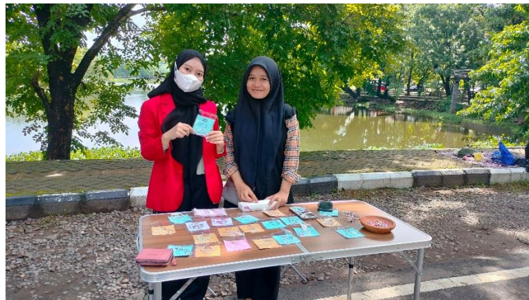
Wawancara bersama pelaku UMKM yang tidak mengikuti program Inkubator UMKM Makassar (Carr Free Day Unhas Makassar, 11 Februari 2024, pukul 08.50 WITA)