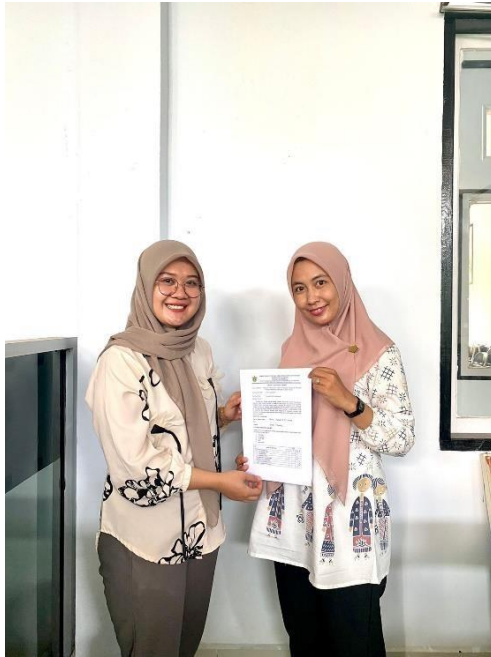
Ahli Materi 1