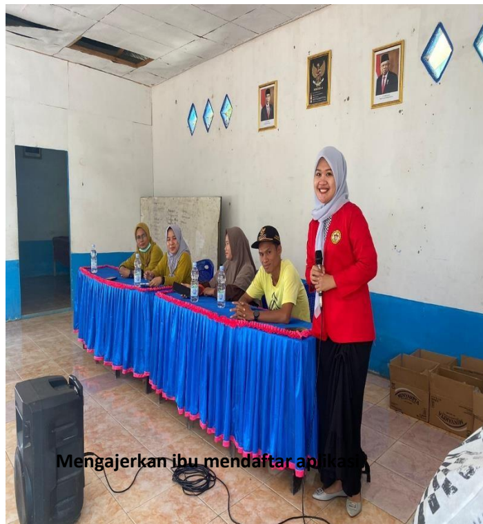
Mengajarkan ibu mendaftar aplikasi