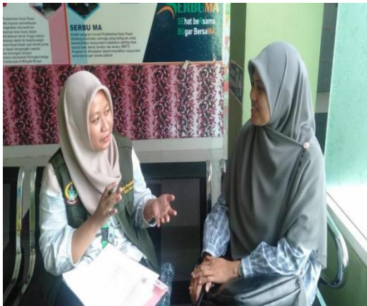
Gambar : Melakukan wawancara dengan TPG