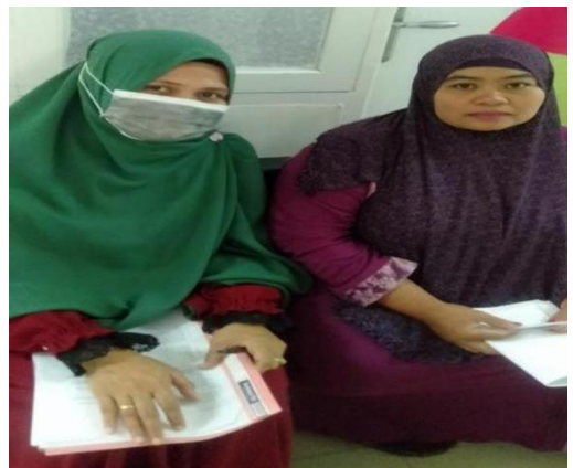
Gambar : Melakukan wawancara dengan Ibu Hamil Puskesmas