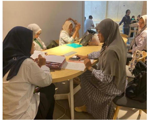
Gambar : Melakukan wawancara dengan TPG