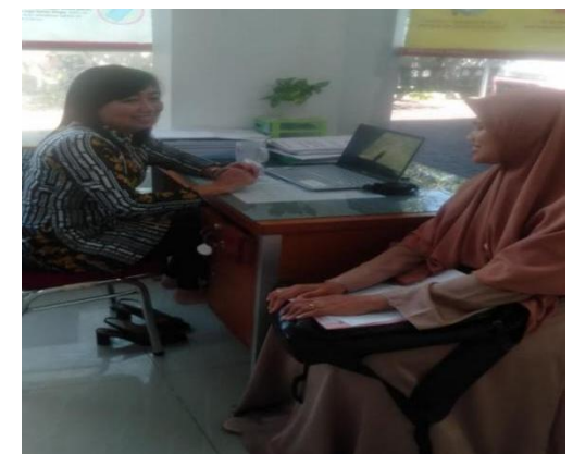
Gambar : Melakukan wawancara dengan Bidan Puskesmas