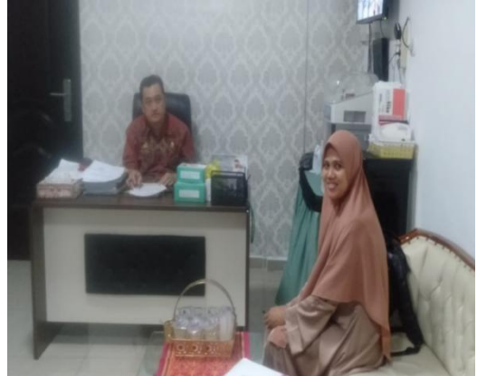
Gambar : Melakukan wawancara dengan Kepala Puskesmas Tamalate