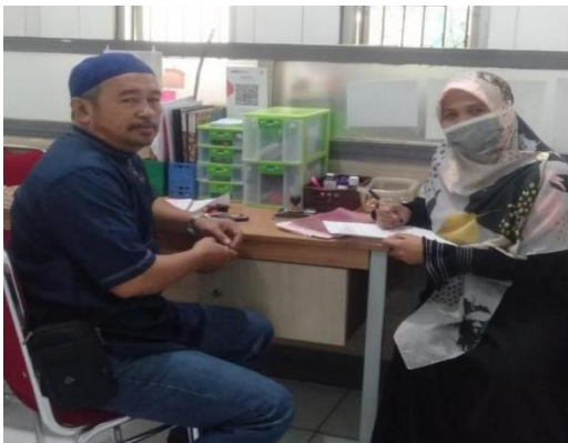
Gambar : Melakukan wawancara dengan Kepala Puskesmas Sudiang