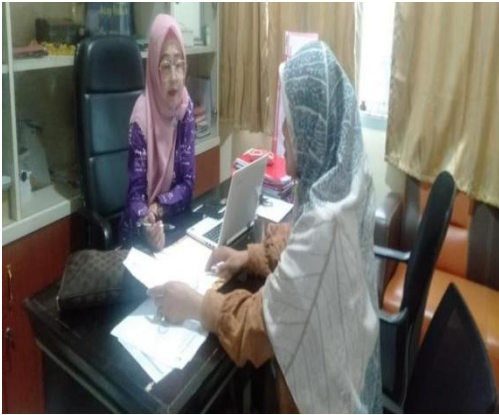
Gambar : Melakukan wawancara dengan Kepala Seksi Kesehatan