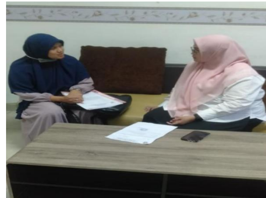
Gambar : Melakukan wawancara dengan Kepala Puskesmas