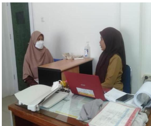
Gambar : Melakukan wawancara dengan Bidan Puskesmas