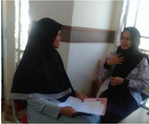
Gambar : Melakukan wawancara dengan Supervisor ASS Kota