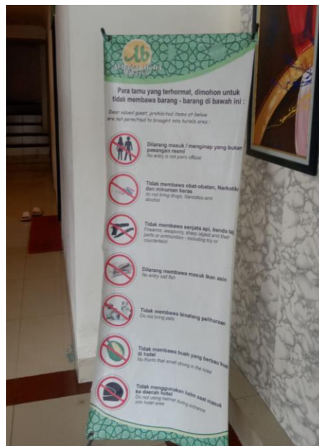
Peraturan Hotel Al-Badar