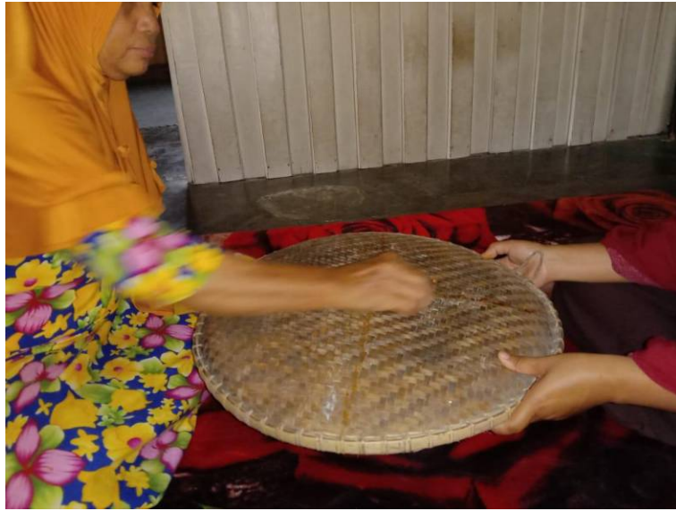
Menggoskan kunyit dan kapur di atas tampah oleh sanro