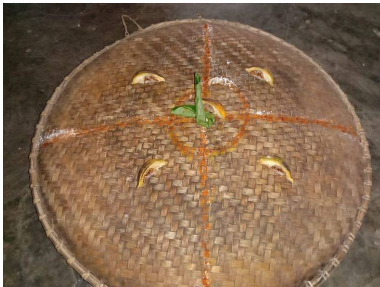
Tampak bagian atas tampah yang akan digunakan metari