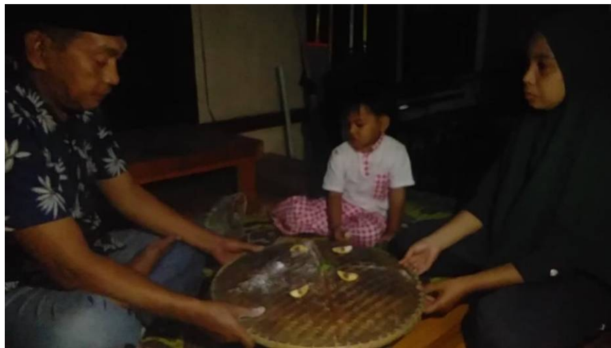
Salah satu cara memegang tampah ritual dengan kedua tangan