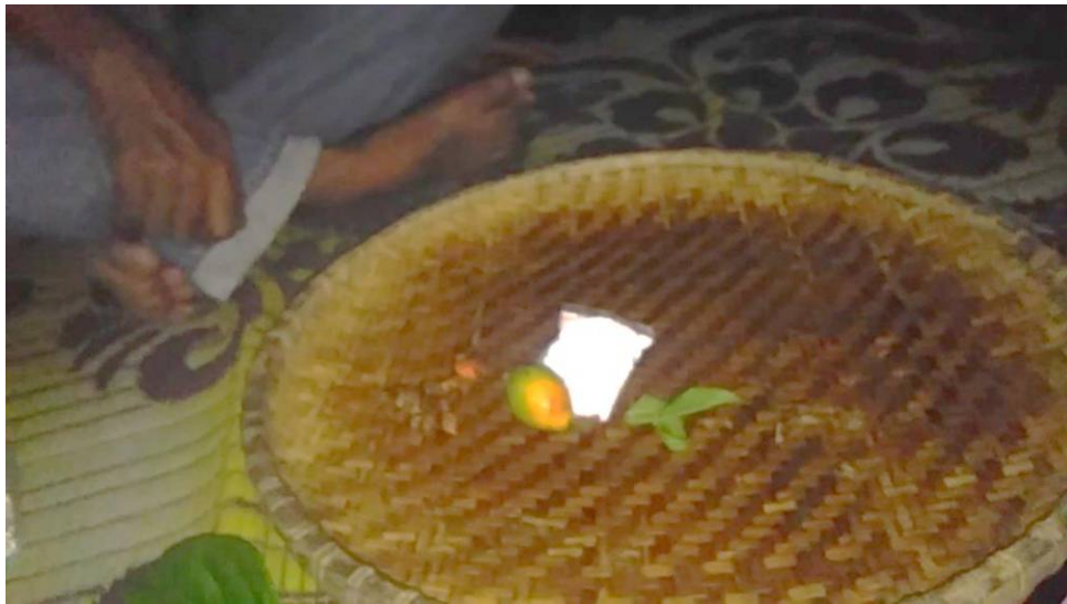
Pua Sumardi memperlihatkan bahan-bahan yang akan digunakan dalam mometari