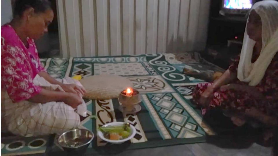
Sanro Nia mempersiapkan bahan untuk metari