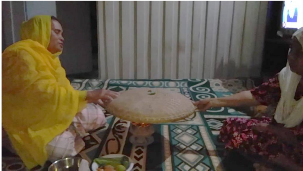
Ketika sanro bertanya dengan Dewata untuk mengidentifikasi karakter penyakit seseorang