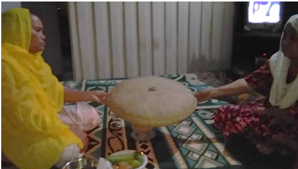
Tampah mulai bergerak dengan sendirinya (ke kanan dan ke kiri)