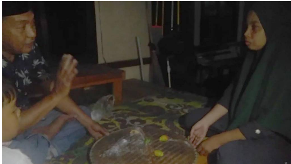
Ketika menyampaikan hasil metari yang dilakukan kepada peneliti