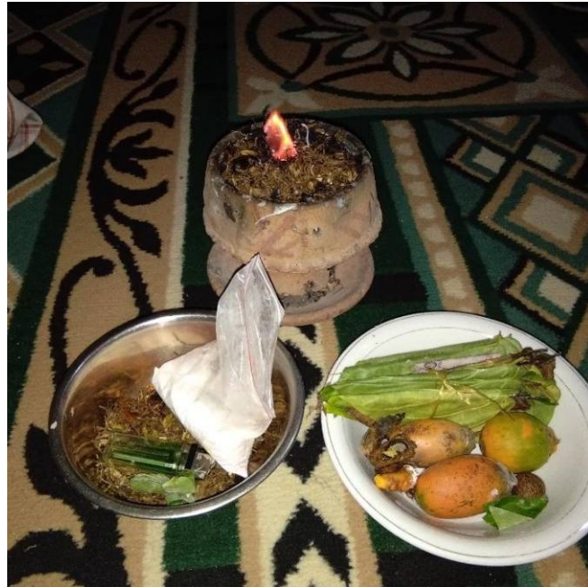
Benda-benda yang digunakan:dupa-dupa, kapur, buah pinang, daun sirih,