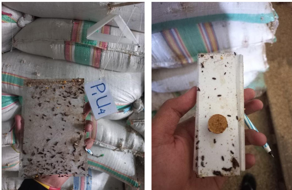
Gambar Lampiran 3. Hama pasca panen yang terperangkap pada perlakuan trap dikombinasikan dengan atraktan