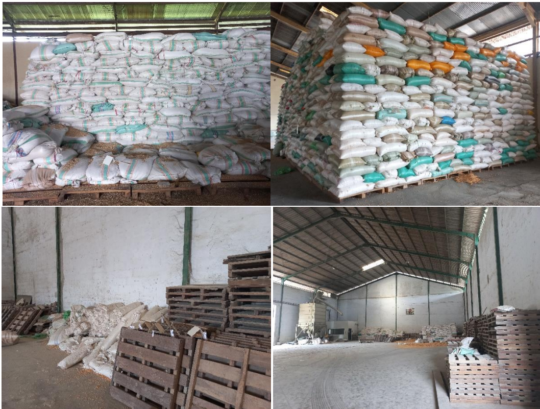
Gambar Lampiran 2. Kondisi di gudang penyimpanan biji jagung