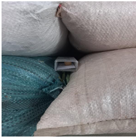
Lampiran Gambar 1. Pemasangan perangkat Delta dan Kotak