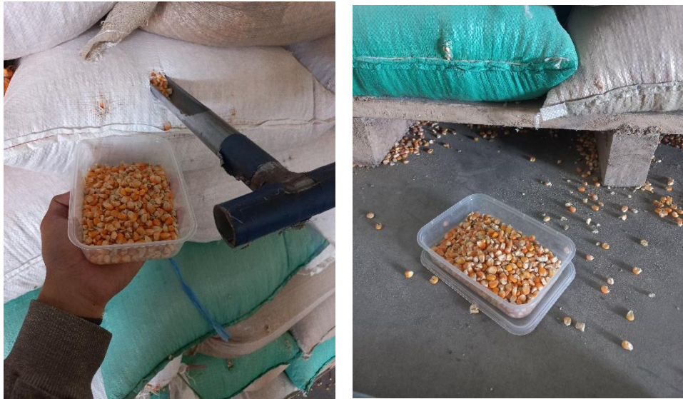
Gambar Lampiran 4. Pengambilan sampel biji jagung