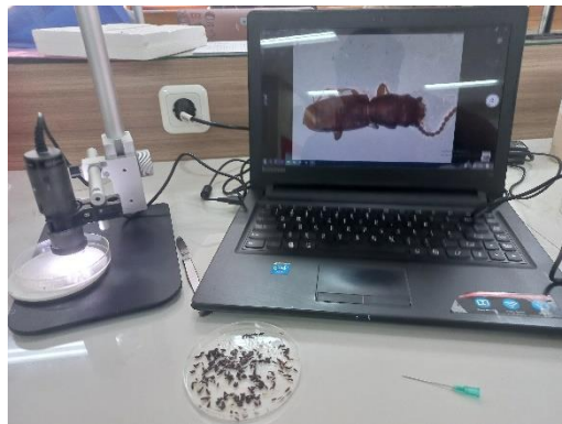
Gambar Lampiran 5. Proses pengambilan hama pada perangkat dan identifikasi hama