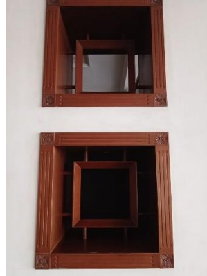
jendela kecil di sisi Graha