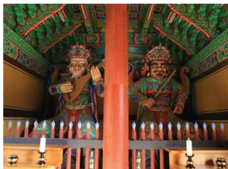
Empat Raja Langit di Kuil Sinheungsa, Sokcho, Korea Selatan