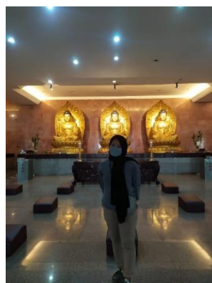
Dokumentasi Observasi Langsung di Graha Sakyamuni