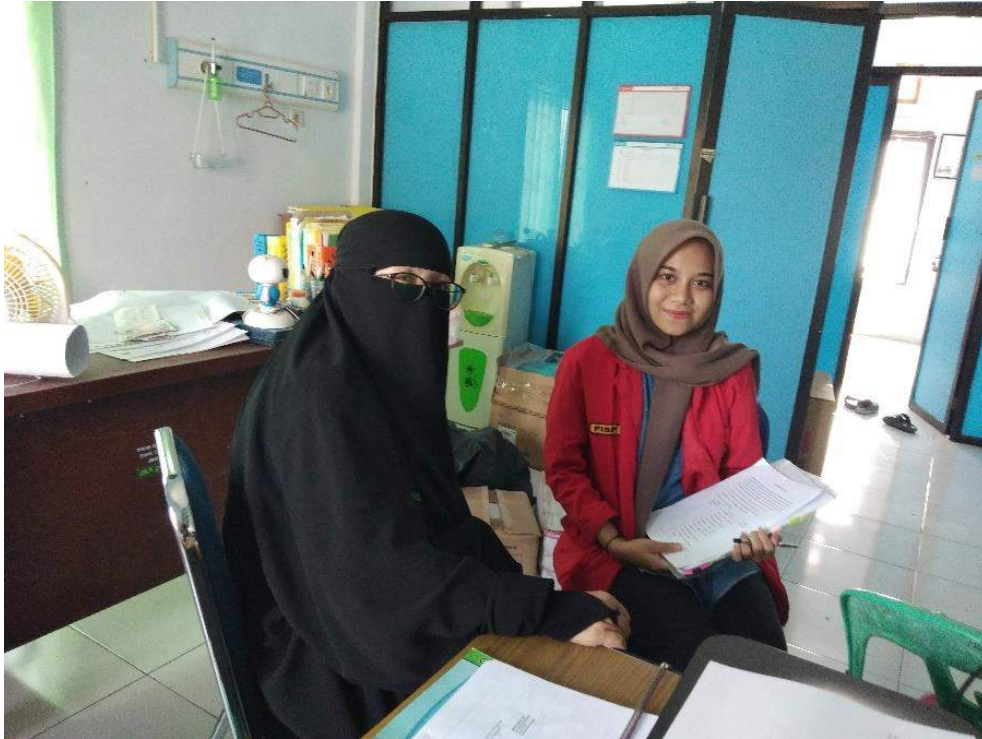
Dokumentasi bersama dengan Ibu Kepala Puskesmas Wara