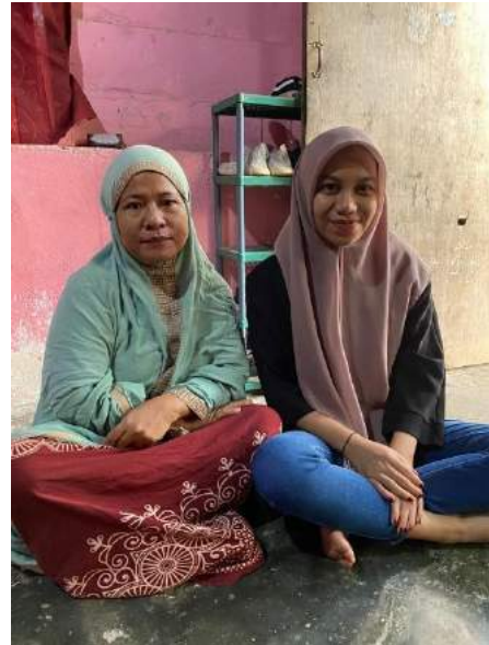
Dokumentasi demonstrasi pembuatan formula 100