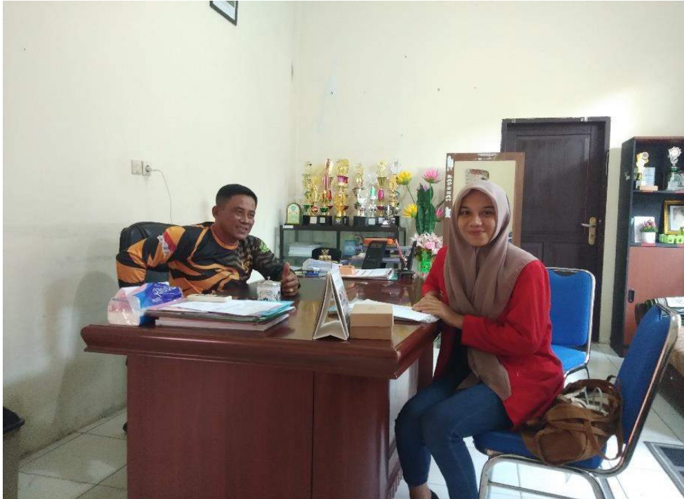
Dokumentasi bersama penanggung jawab stunting di Dinas Kesehatan Kota Palopo