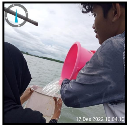
Pengambilan sampel fitoplankton