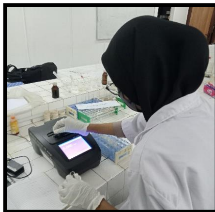
Analisis nitrat dan fosfat