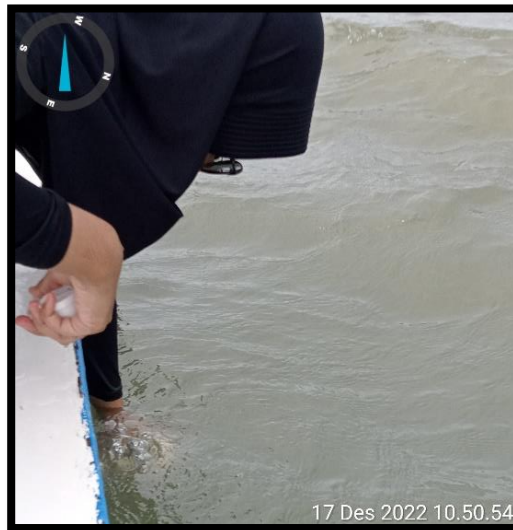
Pengambilan sampel air untuk parameter