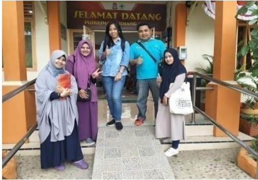
Pengambilan Data Ibu Menyusui di Puskesmas Sudiang Raya Kota Makassar