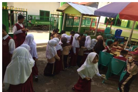
Suasana Pembagian Jajanan Coffee Break