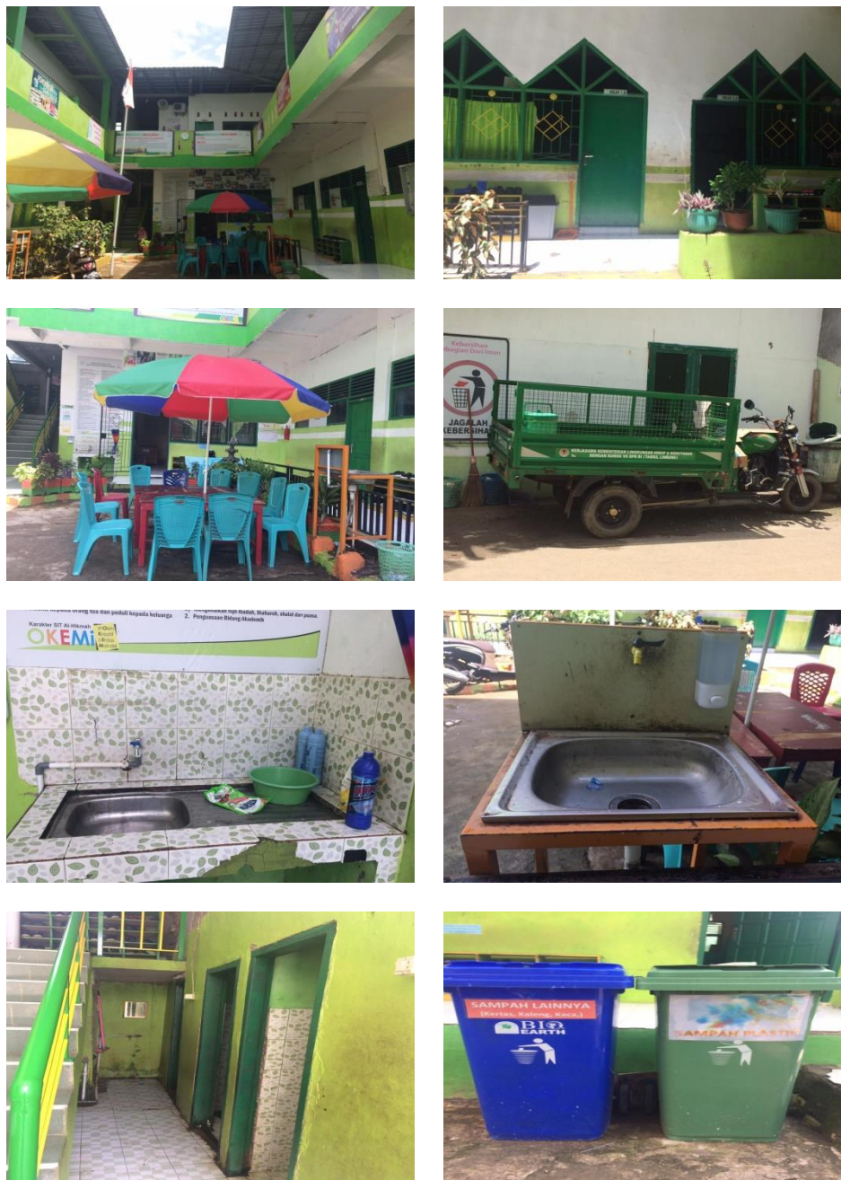
Sarana dan Prasarana di SDIT Al-Hikmah Maros