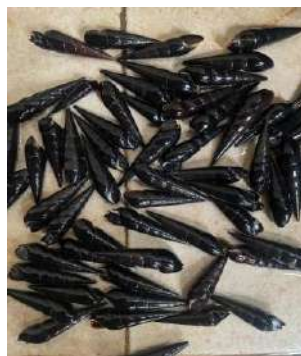
Gambar. 7 Tutut/Keong Sungai ( bellamiya javanica )

Keong sawah ataupun keong sungai adalah sejenis siput air yang mudah di jumpai di perairan tawar Asia tropis. Hewan tercangkang ini dikenal juga sebagai siput sawah, siput air atau tutut ( bellamiya javanica ) . Cangkang keong sawah atau cangkang tutut adalah pelindung karena cangkangnya bersifat keras dan keong tutut memiliki tubuh yang lunak. Cangkang tersebut mengandung banyak kalsium, karena di dalamnya terkandung kalsium karbonat ( CaCO_3 ) atau zat kapur yang sangat tinggi, sehingga dapat bereaksi dengan baik dengan semen sebagai bahan utama pembuatan beton. CaCO_3 atau zat kapur adalah salah satu bahan untuk pembuatan semen. Pada dasarnya, CaCO_3 atau zat kapur dapat ditemukan di kulit telur, cangkang keong, dan beberapa cangkang kerang.