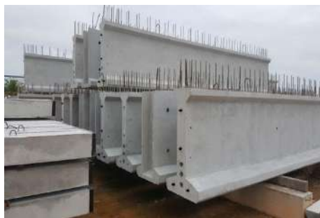
Gambar. 5 Beton Prategang