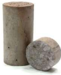
Gambar. 1 Beton Normal