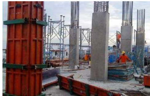
Gambar. 2 Beton Bertulang Pada Kolom Bertulang