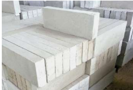
Gambar. 4 Beton Ringan

melampaui berat isi maksimum beton 1850 kg/m 3 kering udara dan harus memenuhi ketentuan kuat tekan dan kuat tarik beton ringan untuk tujuan struktural.