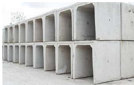
Gambar. 3 Beton Pracetak