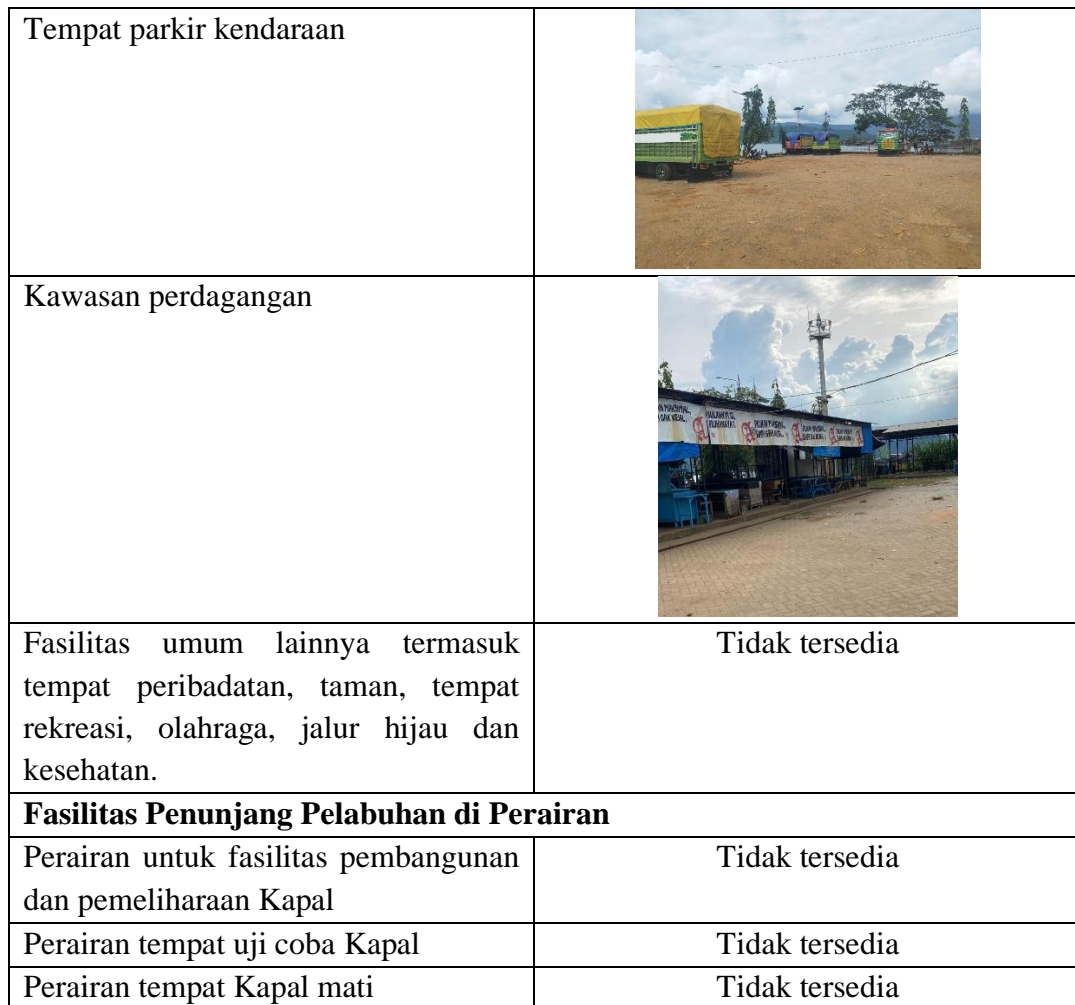
Lampiran 7 Gambar lokasi penelitian