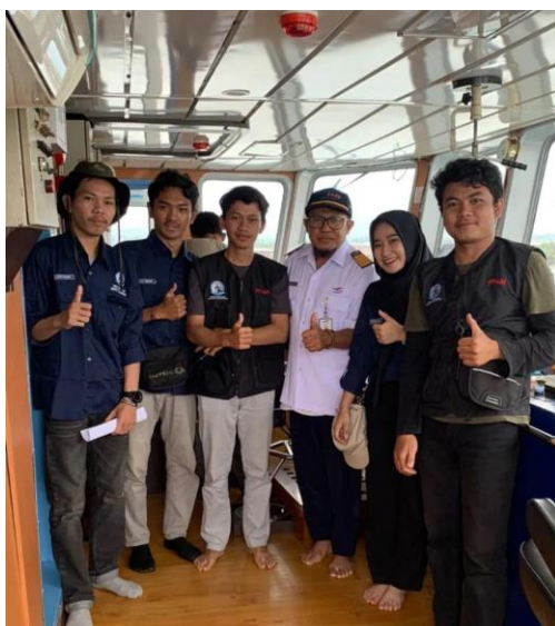
Lampiran 15 Dokumentasi lainnya