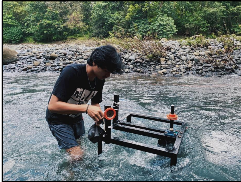
Gambar C3. Dokumentasi pengambilan data kincir air savonius