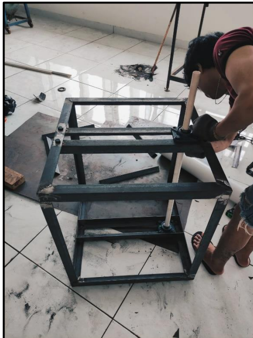
Gambar C2. Dokumentasi pembuatan kincir air savonius