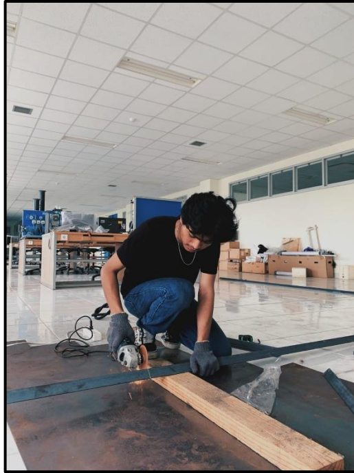
Gambar C1. Dokumentasi pembuatan kincir air savonius