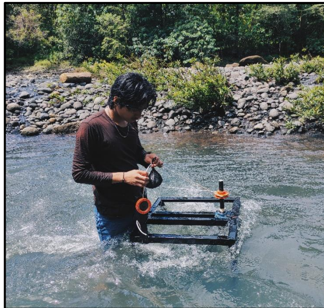
Gambar C4. Dokumentasi pengambilan data kincir air savonius