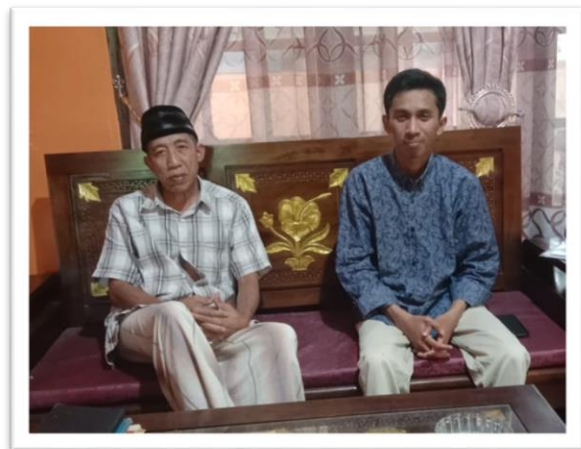
Keterangan : Wawancara bersama Tokoh Masyarakat