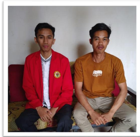
Keterangan : Dokumentasi bersama Ketua dan Pengurus BUM Desa Sumber Rezeki, BUM Desa Sipakarennue, dan BUM Desa Sipakatau