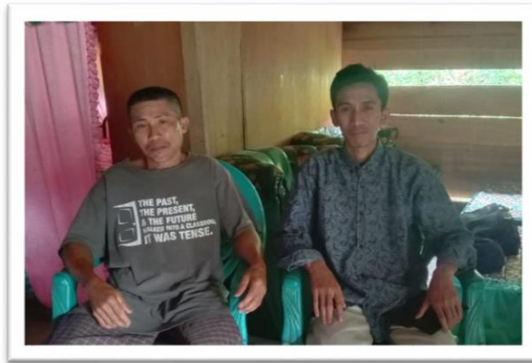
Keterangan : Dokumentasi wawancara bersama Ketua BPD Desa Bontojai, BPD Desa Pattuku dan Ketua BPD Desa Bana.