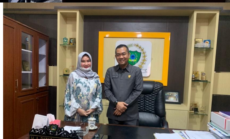
Bersama Ketua Tim Pemenangan Paslon No.1 / Ketua DPRD Kab. Maros