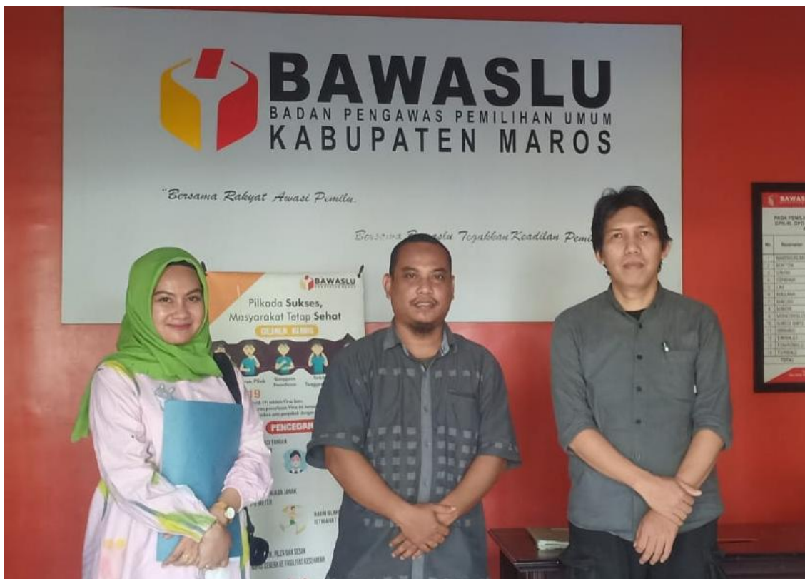
BERSAMA KETUA DAN KOMISIONER BAWASLU KAB. MAROS