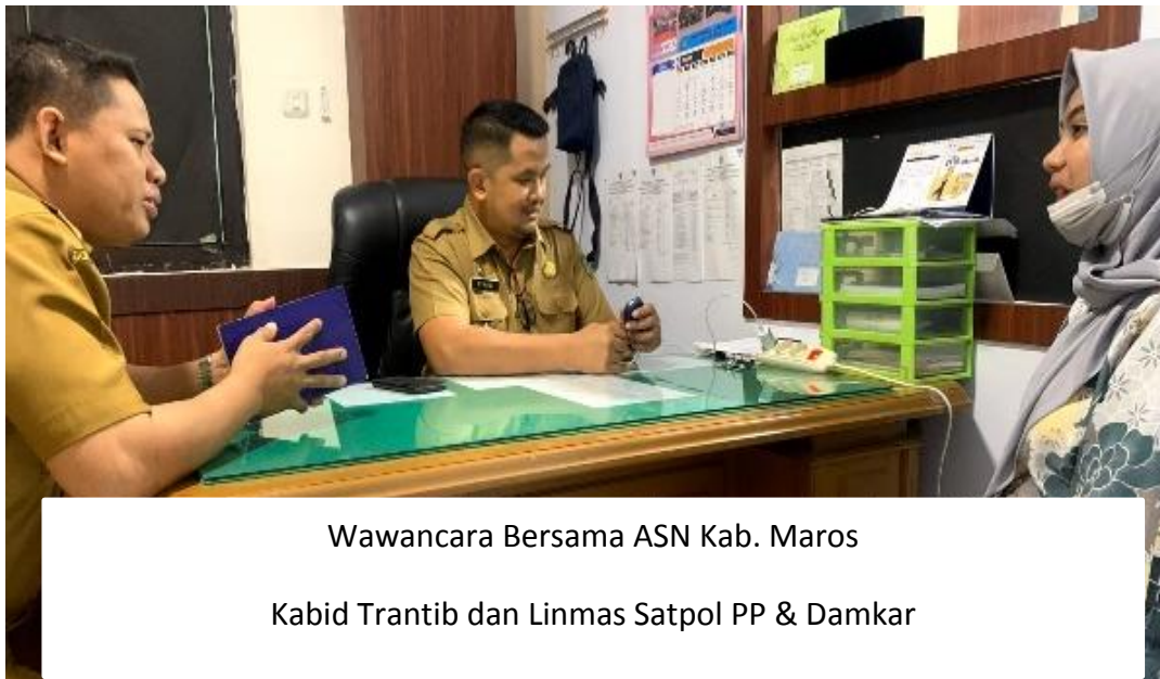
Wawancara Bersama ASN Kab. Maros Kabid Trantib dan Linmas Satpol PP & Damkar