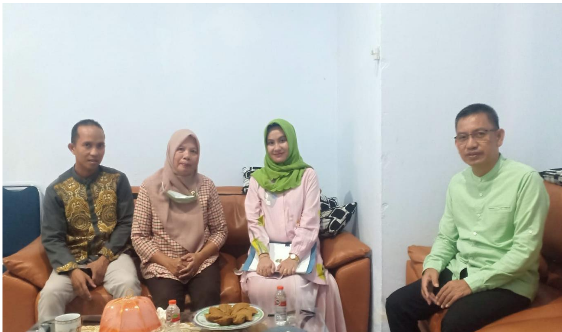
BERSAMA KETUA DAN KOMISIONER KPU KAB. MAROS