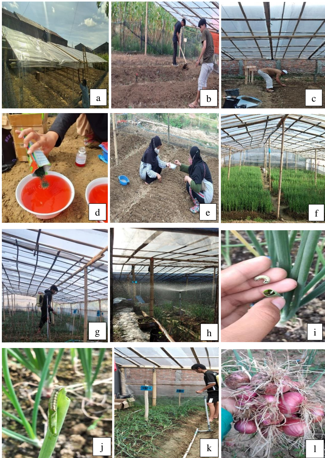
Lampiran Gambar 3. Proses pelaksanaan penelitian (a) Pembuatan naungan, (b) Pembuatan bendengan, (c) Pembuatan larikan, (d) Perendaman benih menggunakan GA3 (e) Penaburan benih pada larikan (f) Semaian (g) Waktu aplikasi paklobutrasol (h) Penyiraman (i dan j) Hama yang menyerang pertanaman (k) Waktu aplikasi pestisida (l) Panen.