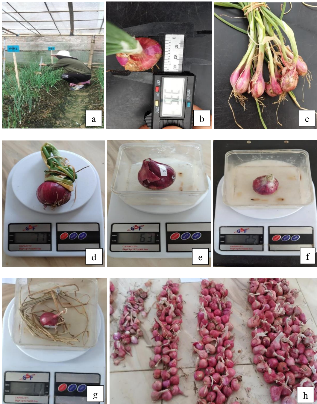
Lampiran Gambar 4. Proses pengamatan parameter (a) Tinggi dan jumlah daun, (b) Diameter umbi, (c) Jumlah umbi, (d) Bobot brangkasan basah (e) Bobot umbi basah (f) Bobot brangkasan kering (g) Bobot umbi kering (h) Persentase umbi mini