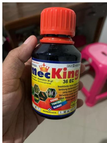
Gambar 5. Insektisida Mecking 36 EC berbahan aktif Abamektin