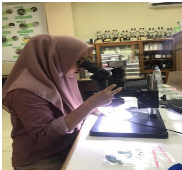
Gambar 2. Mengamati sampel dibawah mikroskop