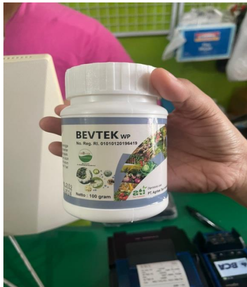
Gambar 5. Bioinsektisida Bevtek berbahan aktif B.bassiana