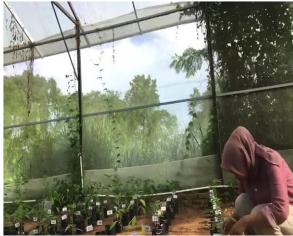
Gambar 1. Pengambilan sampel daun