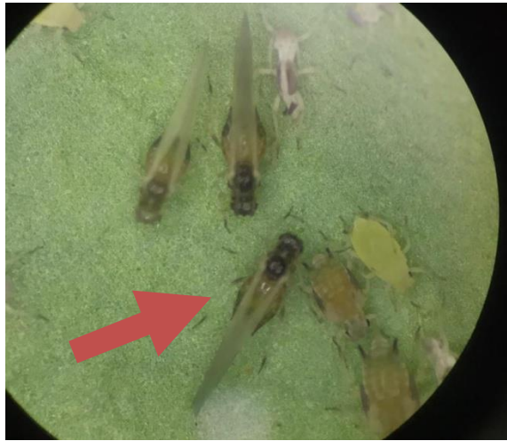
Gambar 3. Imago bersayap A. gossypii