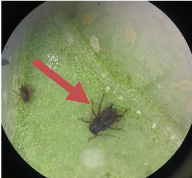
Gambar 6. A. gossypii yang mati akibat terinfeksi Insektisida Abamektin