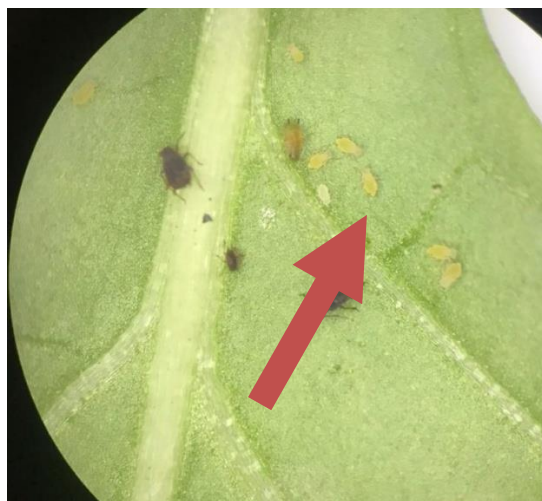
Gambar 5. Nimfa A. gossypii