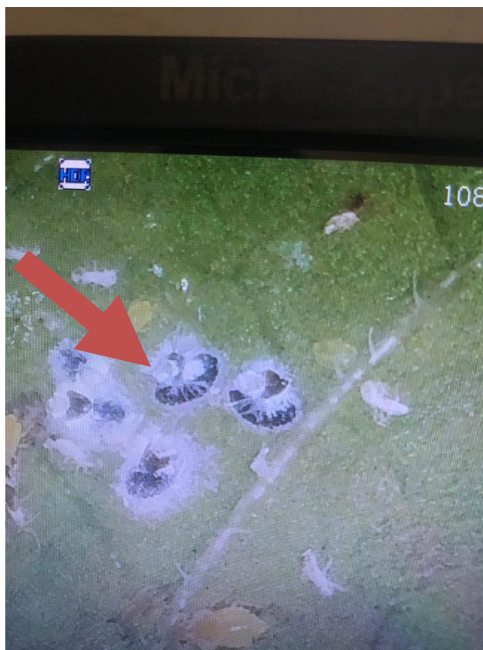
Gambar 7. A. gossypii yang mati akibat terinfeksi Bioinsektisida B. bassiana