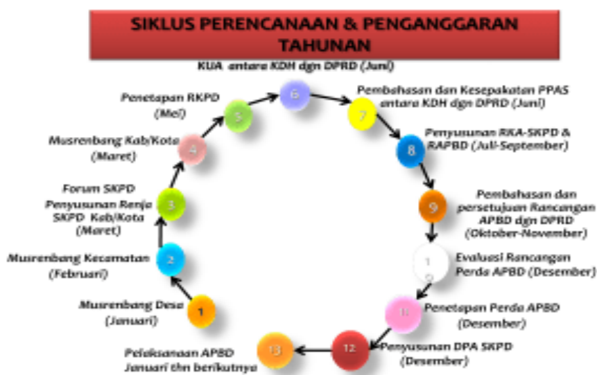
Gambar 1. Siklus Perencanaan dan Penganggaran Daerah

Proses perencanaan puskesmas dimulai dari tingkat desa/ kelurahan, selanjutnya disusun pada tingkat kecamatan dan kemudian diusulkan ke dinas kesehatan kabupaten/ kota. Perencanaan puskesmas yang diperlukan terintegrasi dengan lintas sektor kecamatan dan diusulkan melalui kecamatan ke pemerintah daerah kabupaten / kota (lihat gambar 1).