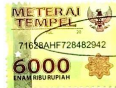
Lita Astrid Tarumaselej