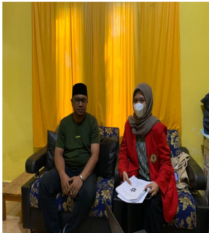
Wawancara dengan Sekretaris Desa Polewalie