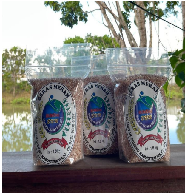
Produk beras Merah BUMDes Paselloreng