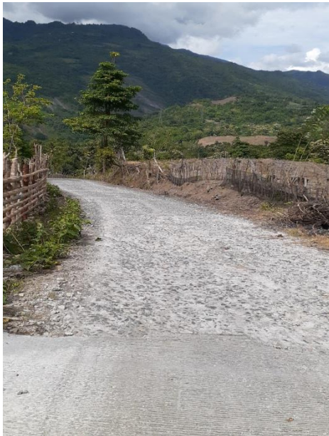
Gambar 8: Kondisi akses jalan di Desa Bakaru