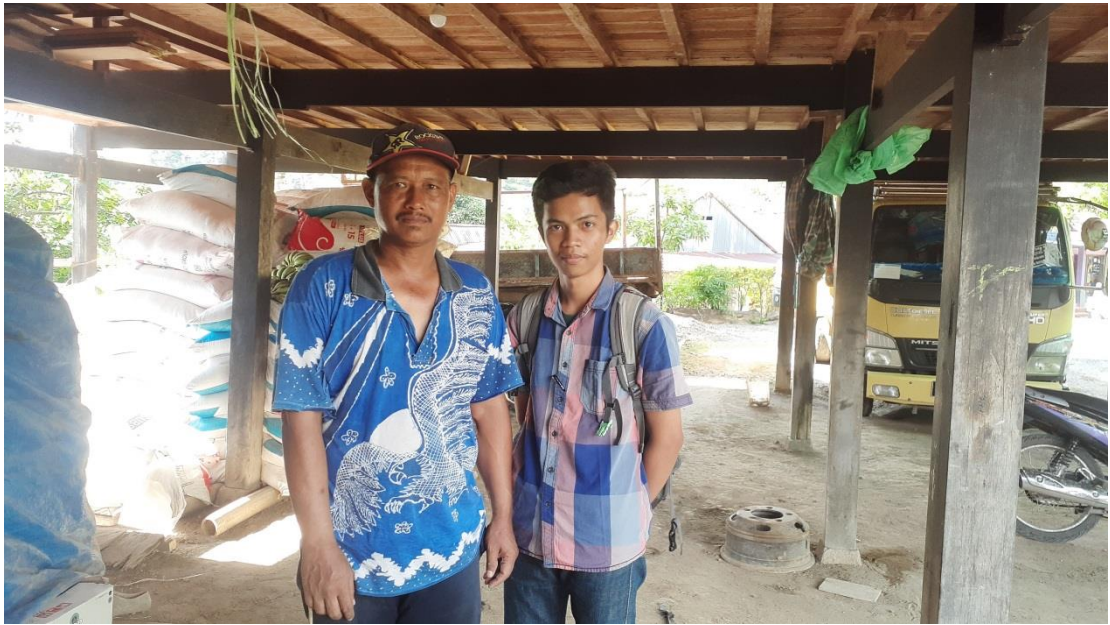
Gambar 2: Wawancara dengan Informan L