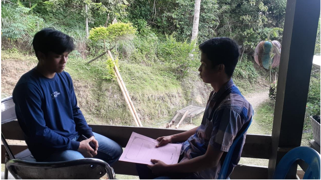
Gambar 1: Wawancara dengan Informan R