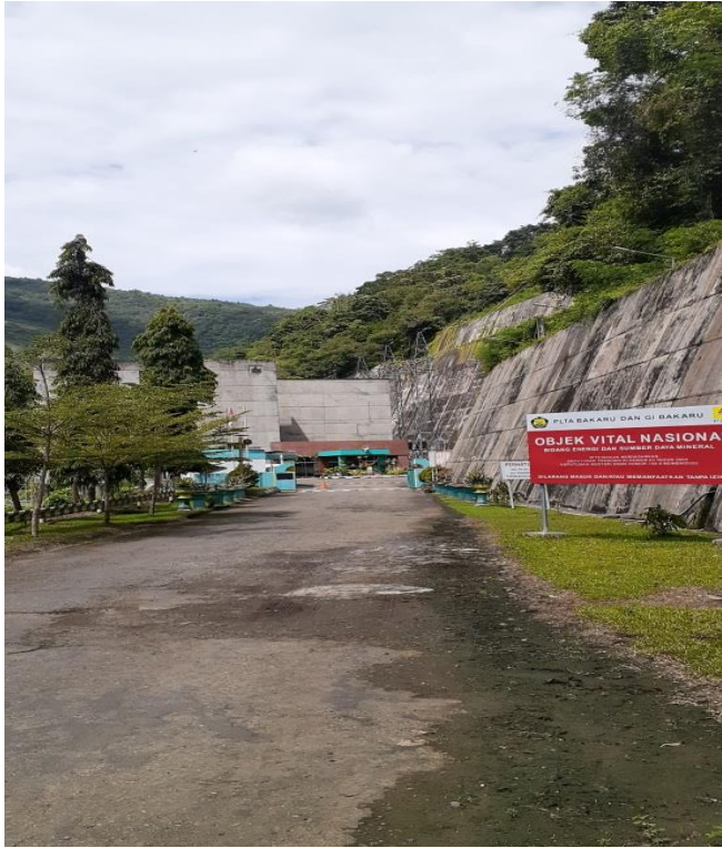
Gambar 7: Kondisi depan PLTA Bakaru