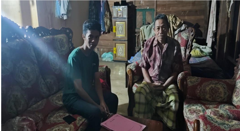
Gambar 5: Wawancara dengan Informan T