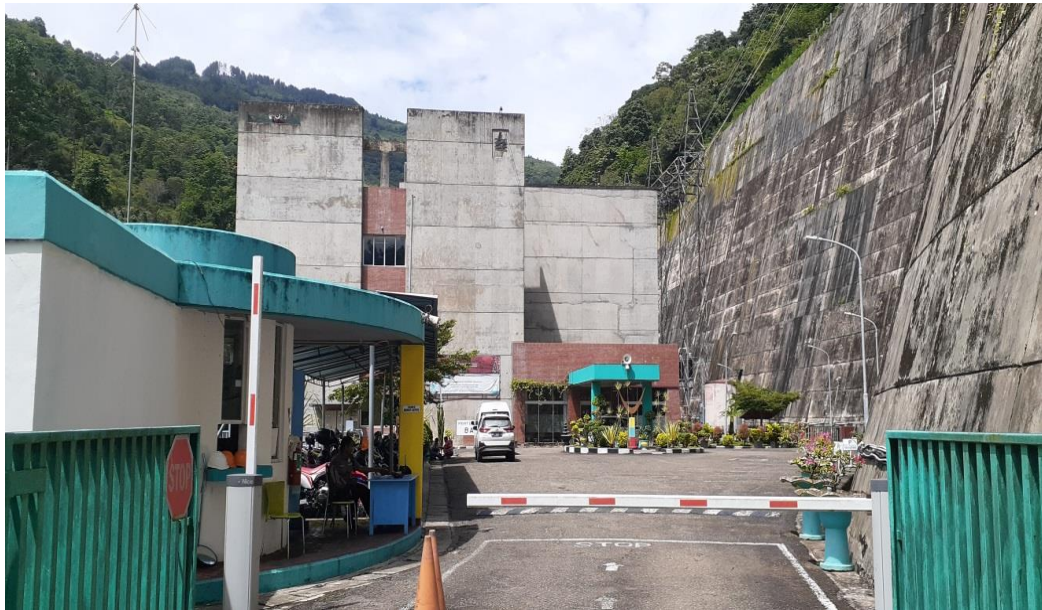
Gambar 6: Power House PLTA Bakaru