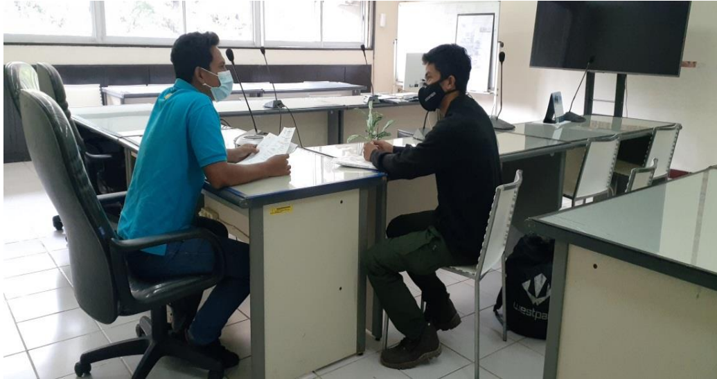
Gambar 3: Wawancara dengan Informan RS