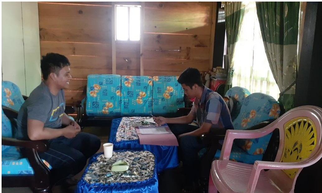
Gambar 4: Wawancara dengan Informan H