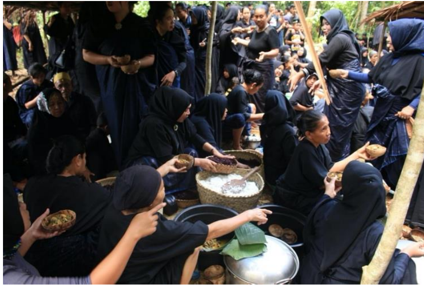
Dokumentasi ritual Andingingi