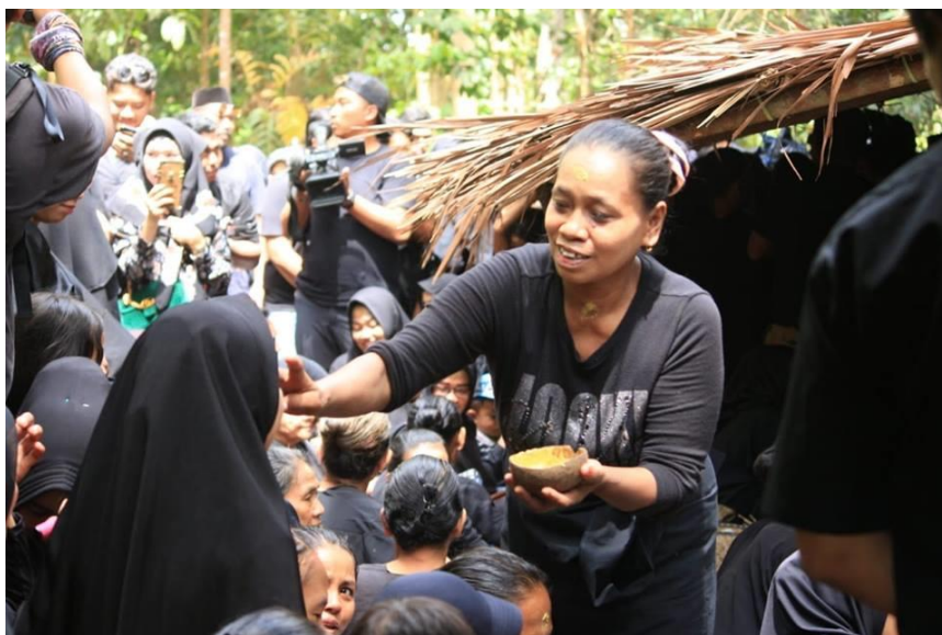
Dokumentasi rangkaian Abacca