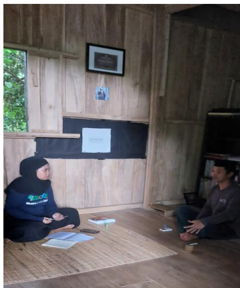
(Wawancara dengan Mail)