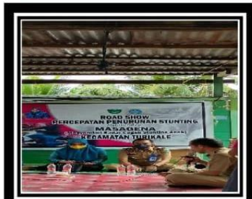
MAROS ( MASAGENA ROAD SHOW )