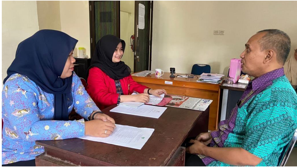
Wawancara dengan Sekretaris Dinas Pemberdayaan Masyarakat dan Desa Kabupaten Maros, tanggal 28 februari 2023.