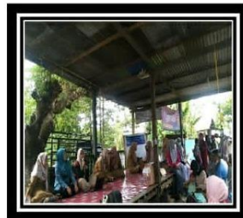
MAPACCING ( MASAGENA PENYULUHAN STUNTING )