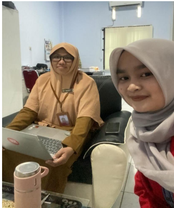
Wawancara dengan Kepala Bidang Kesehatan Masyarakat Dinas Kesehatan Kabupaten Maros, tanggal 03 Maret 2023.