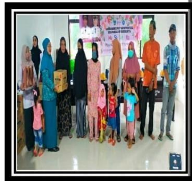
MAPPABESSI ( MASAGENA PEDULI BALITA STUNTING )