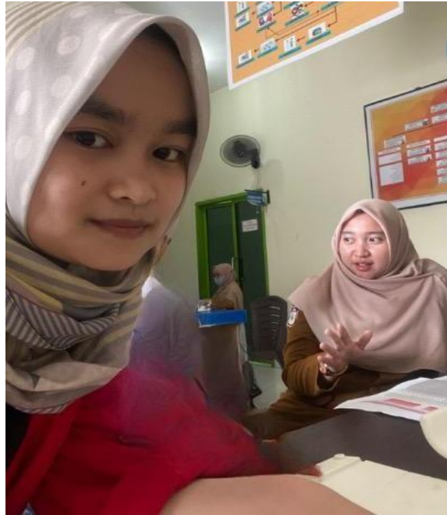
Wawancara dengan Seksi Kesejahteraan Masyarakat Kelurahan Alliritengae Kecamatan Turikale Kabupaten Maros, tanggal 15 Maret 2023