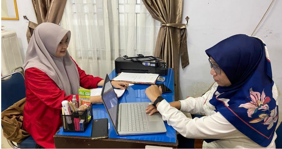
Wawancara dengan satgas stunting BKKBN Dinas Pemberdayaan Perempuan dan Perlindungan Anak Kabupaten Maros, tanggal 07 Maret 2023