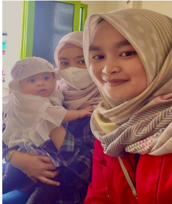
Wawancara dengan masyarakat Kelurahan Alliritengae Kecamatan Turikale Kabupaten Maros, tanggal 15 Maret 2023.