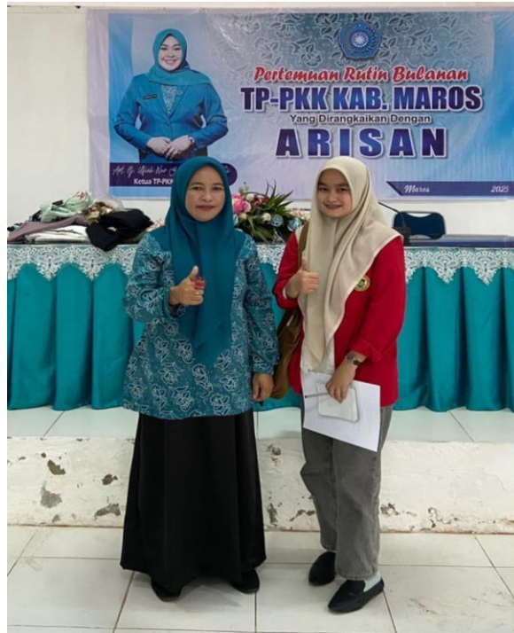
Wawancara dengan Sekretaris TP-PKK Kabupaten Maros, tanggal 1 Maret 2023.