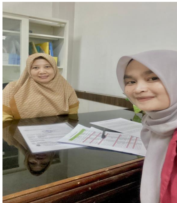
Wawancara dengan Staff Perekonomian dan Kesejahteraan Rakyat (EKOKESRA) Kecamatan Turikale Kabupaten Maros, tanggal 06 maret 2023.