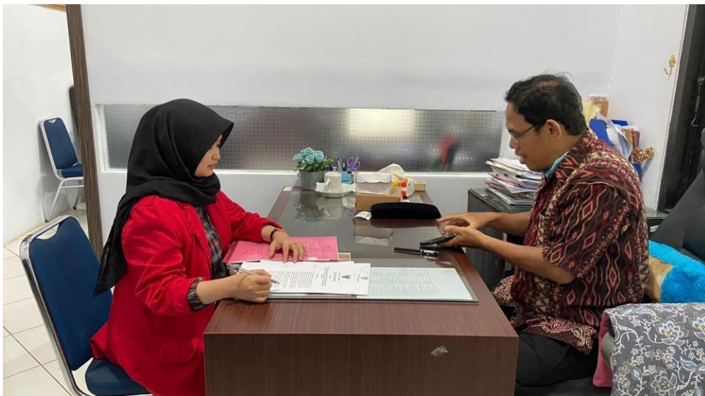
Wawancara dengan Kepala Bidang Fungsional Perencanaan Ahli Muda BAPPELITBANGDA Kabupaten Maros, tanggal 28 februari 2023.