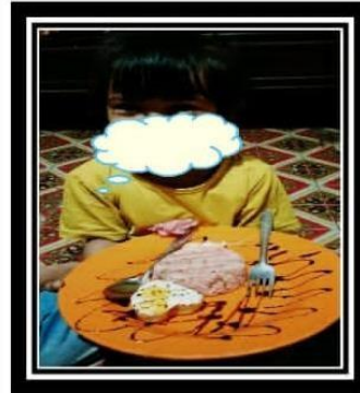
MASSIARA ( MASAGENA ANAK SEHAT SATU TELUR SEHARI )