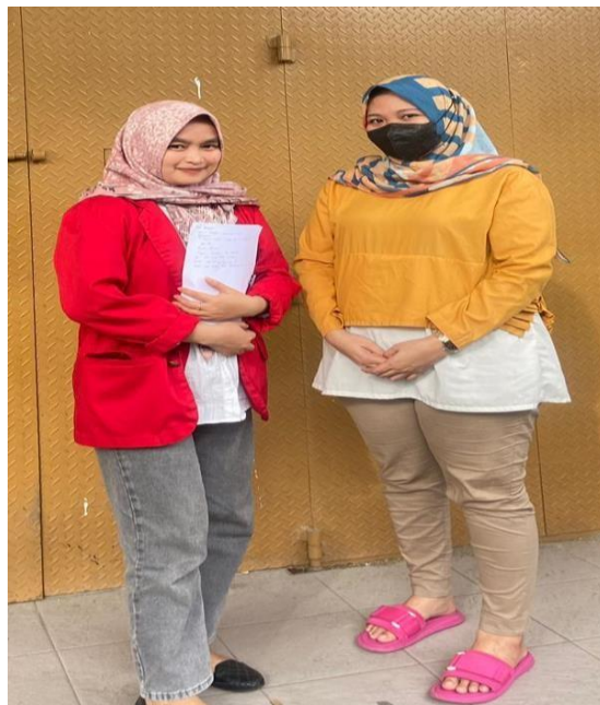
Wawancara dengan masyarakat Kelurahan Alliritengae Kecamatan Turikale Kabupaten Maros, tanggal 16 Maret 2023.