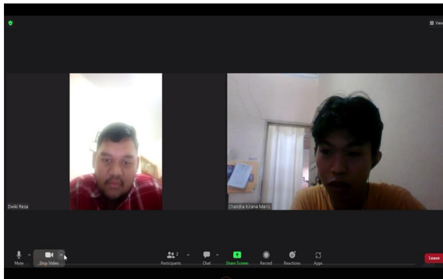
Wawancara dengan peserta pelatihan (1)