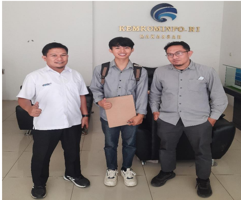
Wawancara dengan Ketua Tim DEA (kiri) dan Ketua TIM TA (kanan) BBPSDMP Kominfo Makassar