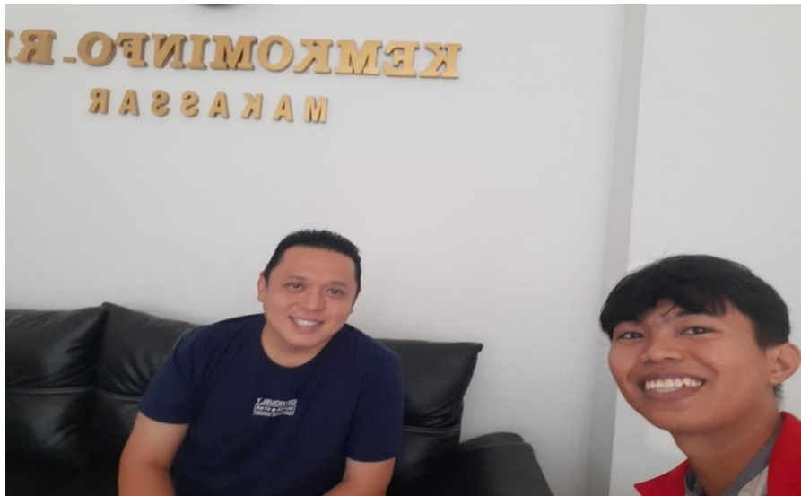
Wawancara dengan Ketua VSGA BBPSDMP Kominfo Makassar