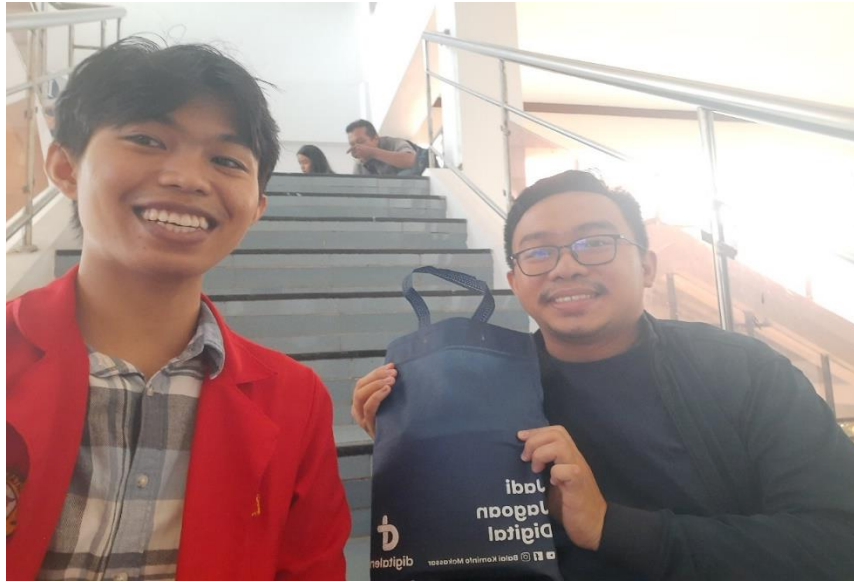
Wawancara dengan peserta pelatihan (3)