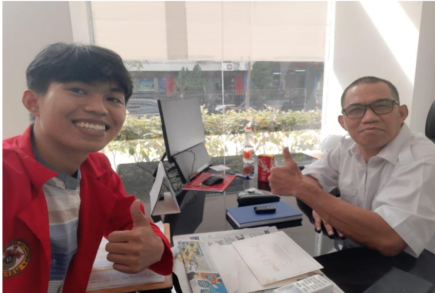
Wawancara dengan Ketua Tim Pengembangan SDM BBPSDMP Kominfo Makassar