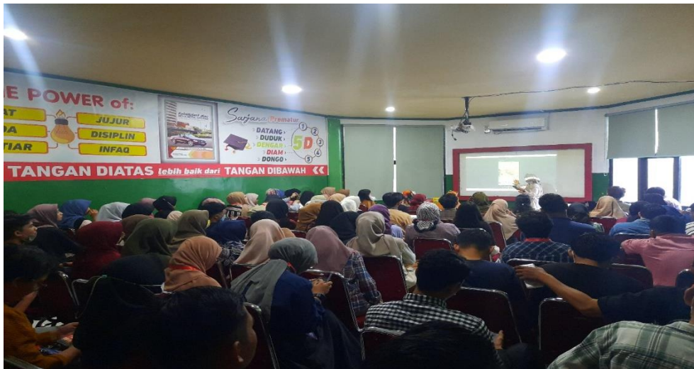
Suasana Pelatihan DEA di STIM Nitro Makassar