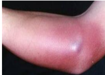
Gambar 1. Tanda inflamasi berupa rubor (kemerahan) (Bhaktiarahayu, 2017)

Kemerahan adalah hal yang biasanya pertama kali terlihat di area yang meradang. Ketika reaksi inflamasi dimulai, arteriol yang menyuplai area tersebut melebar, yang memungkinkan akan lebih banyak darah yang mengalir. Kapiler yang sebelumnya kosong dengan cepat diisi dengan darah. Kondisi ini dikenal sebagai hiperemia atau kongesti yang menyebabkan kemerahan. Timbulnya hiperemia pada awal proses inflamasi bersifat neurogenik dan secara kimiawi diatur oleh pelepasan zat seperti histamin.