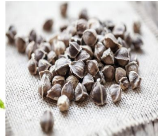
(3) Biji kelor