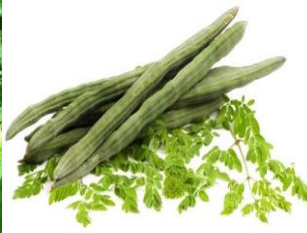
(2) Buah kelor