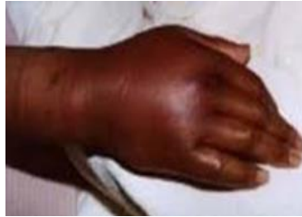
Gambar 2. Tanda inflamasi berupa bengkak (tumor) (Bhaktiarahayu, 2017)

Pembengkakan disebabkan oleh suplai cairan dan sel dari darah yang bersirkulasi ke jaringan pembuluh darah. Campuran cairan dengan sel yang terkumpul di daerah peradangan disebut eksudat. Tumor dalam konteks gejala infeksi bukanlah sel kanker seperti yang umum dibicarakan, tetapi pembengkakan. Pada area yang mengalami infeksi atau radang akan terjadi pembengkakan karena peningkatan permeabilitas sel dan peningkatan aliran darah.