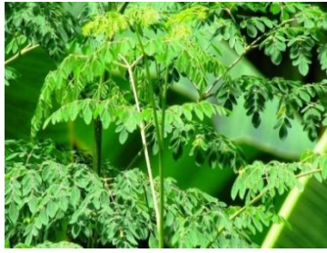
(1) Daun kelor